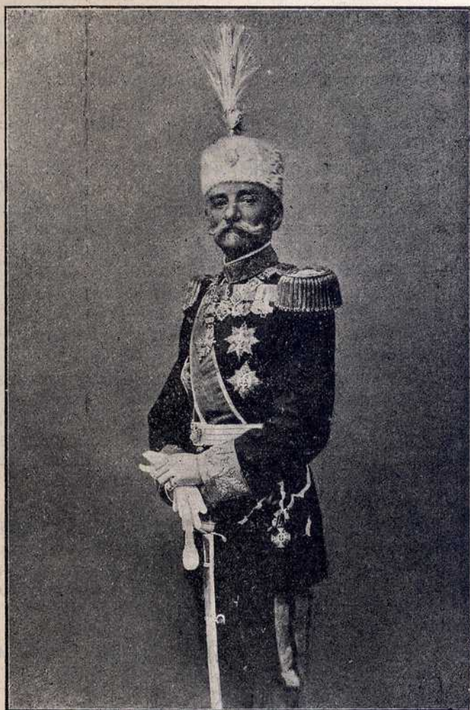
НАСЛЕДНИК СРПСКОГ ПРЕСТОЛА

ОСЛОБОДИЛАЦ СКОПЈА, ВЕЛЕСА, ПРИЛИПА, БИ- ТОЉА, ОХРИДА, ШТИПА, РАДОВИШТА И. Т. Д.