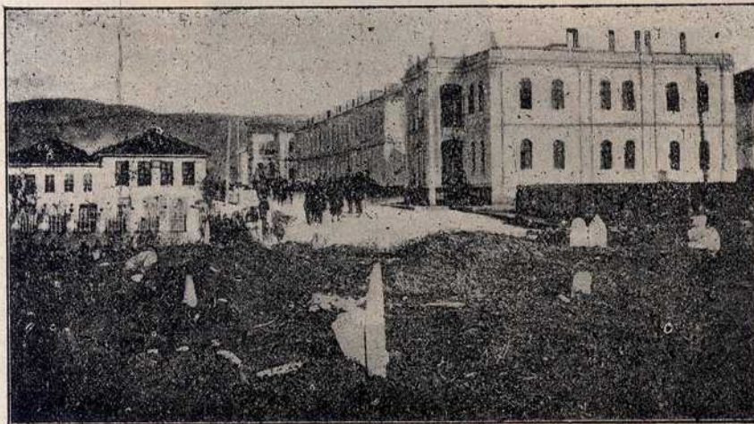
Митровица на Косову: нове касарне