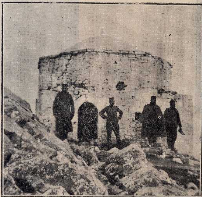
Џафер Касаб — Гроб Вендербергев