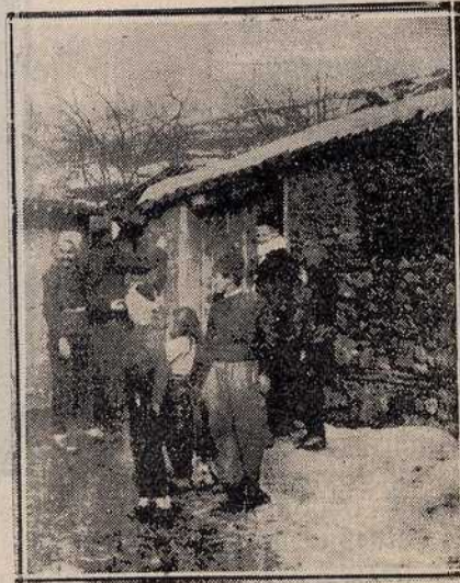
Војска пописује становништво у Битољу.