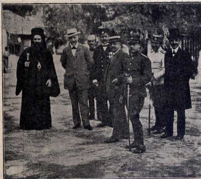
Грчки министар председник Веницелос као гост у Битољу