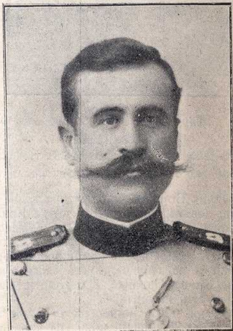
ПЕШАДИЈСКИ КАПЕТАН I. КЛАСЕ