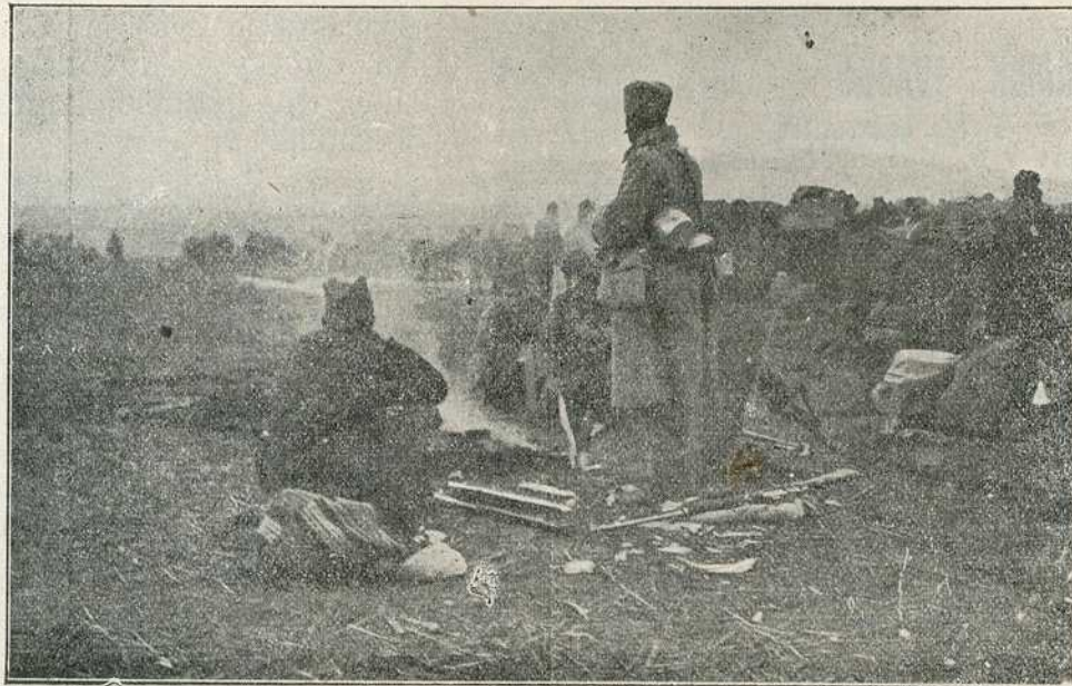
ОДМОР ПОСЛЕ ЈЕДНЕ ПОВЕДЕ — СНИМАК ПАЈЕ ЈОВАНОВИЋА