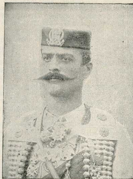
МИНИСТАР-ПРЕДСЕДНИК БРИГАДИР Митар Мартиновић КОМАНДАНТ ОПСАДЕ СКАДРА