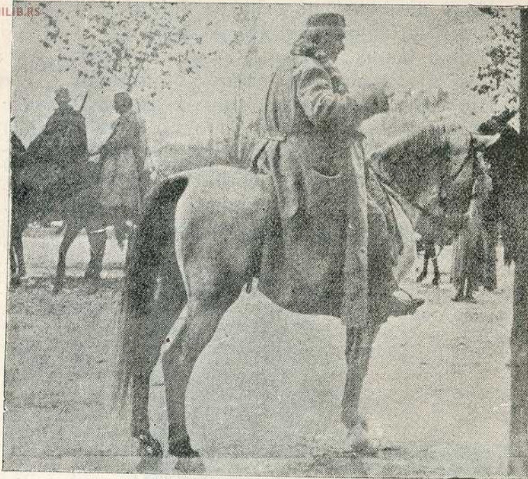
Њ. В. Краљ Никола на бојном пољу на својем белцу