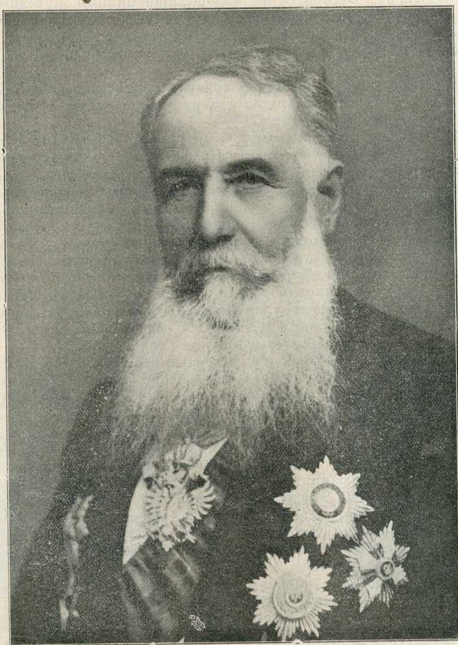
НИКОЛА П. ПАШИЋ ПРВИ ДЕЛЕГАТ СРБИЈЕ У БУКУРЕШТУ.

Излази сваке недеље. Ванредно по потреби. — Претплата тромесечно два динара.