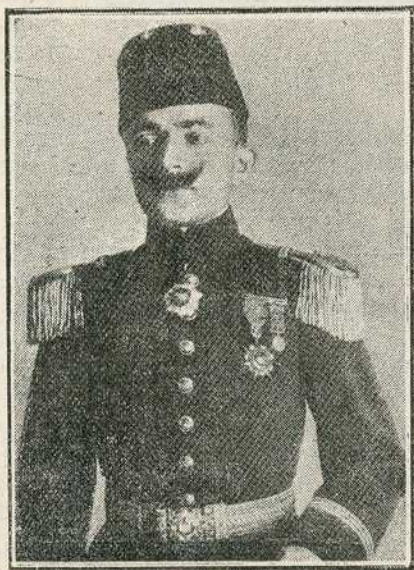
Енвер беј, ОСВАЈАЧ ЈЕДРЕНА

Наша слика представља у целој свету добро знаног првака Младотурског Енвер беја, човека исплинске енергије и велике одлучности, који је збацио Абдул Хамида, у Триполису задао јада Талијанима и отео Једрене Бугарима. Он је народни јунак за чију се личност везују појмови о части и слободи Отоманства.