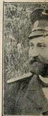
Резервни пешад † Живота срески писар Славно пао