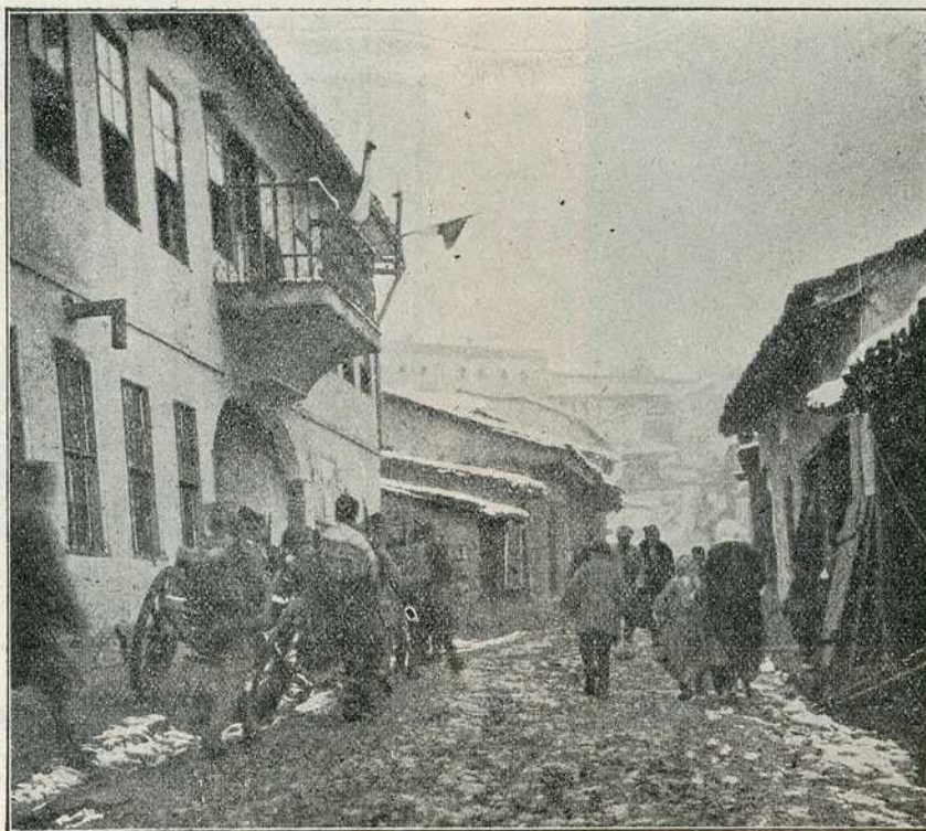
Први дан уласка српске војске у царско Скопље