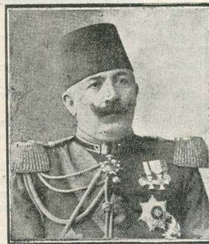
ГЕНЕРАЛИСИМ Изет паша.

Наша слика представља у целој свету добро знаног првака Младотурског Енвер беја, човека исплинске енергије и велике одлучности, који је збацио Абдул Хамида, у Триполису задао јада Талијанима и отео Једрене Бугарима. Он је народни јунак за чију се личност везују појмови о части и слободи Отоманства.