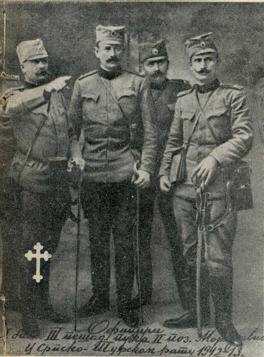
андант I. батаљона III. пешадијског пука другог позива, но пао на Великом Говедарнику.