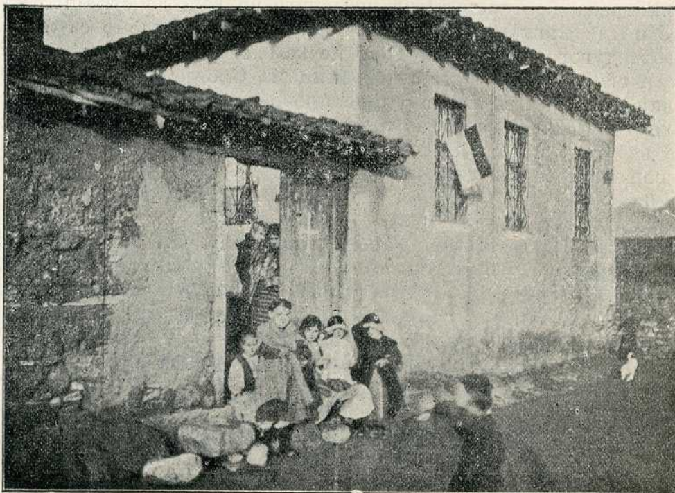
Први дани слободе у Скопљу

Деветог изјутра, трећег дана, опет у расвитак Бугари отпочеше прво јаком а затим све слабијом ватром да обасипљу наше положаје. Око пет сати изјутра напред трећи, а за њим други батаљон трећег прекоброј-