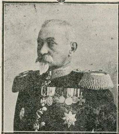
ГЕНЕРАЛ Никодије Стефановић КОМАНДАНТ МОРАВСКЕ ДИВИЗИЈСКЕ ОБЛАСТИ