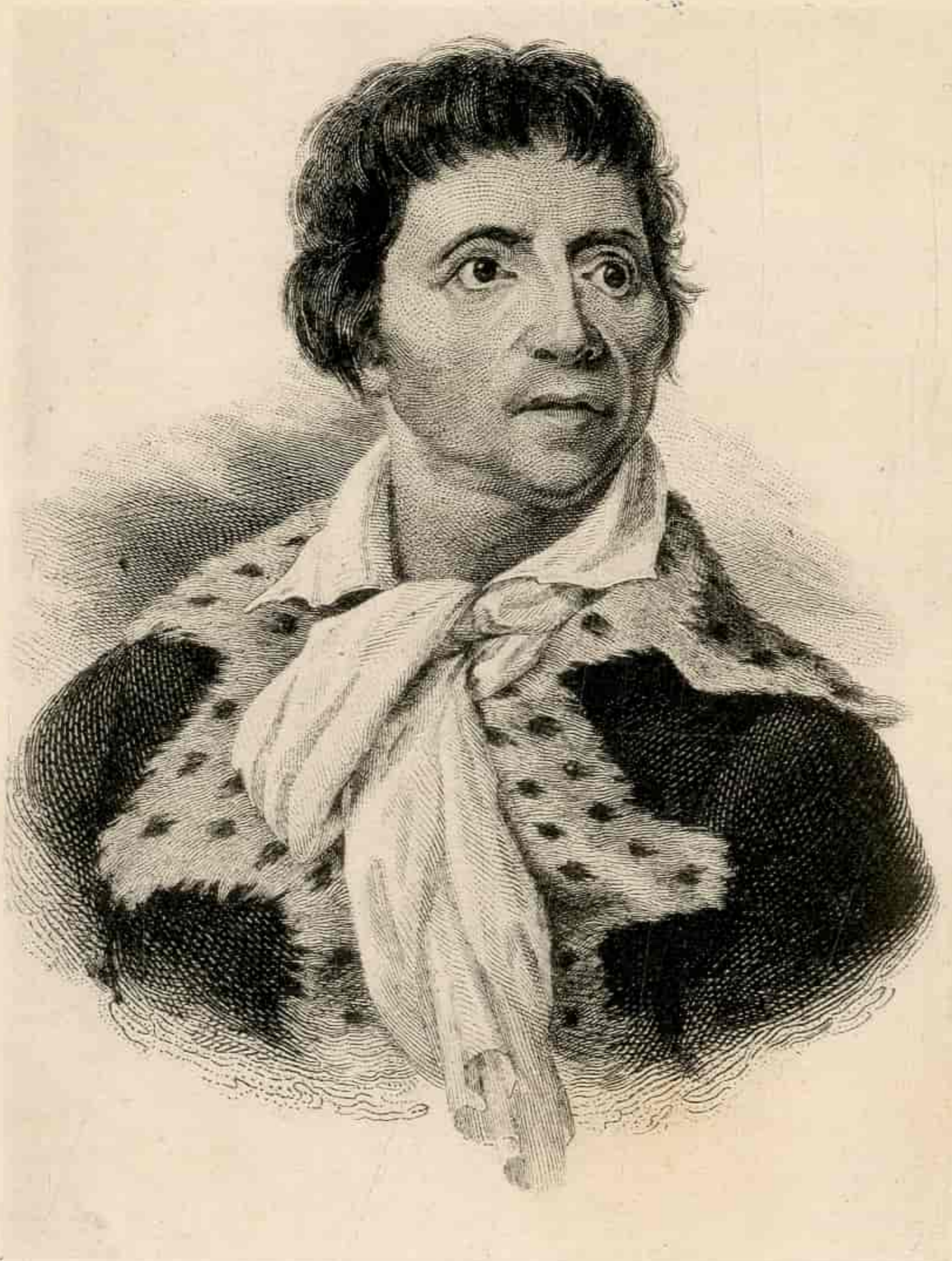
Jean Paul Marat.