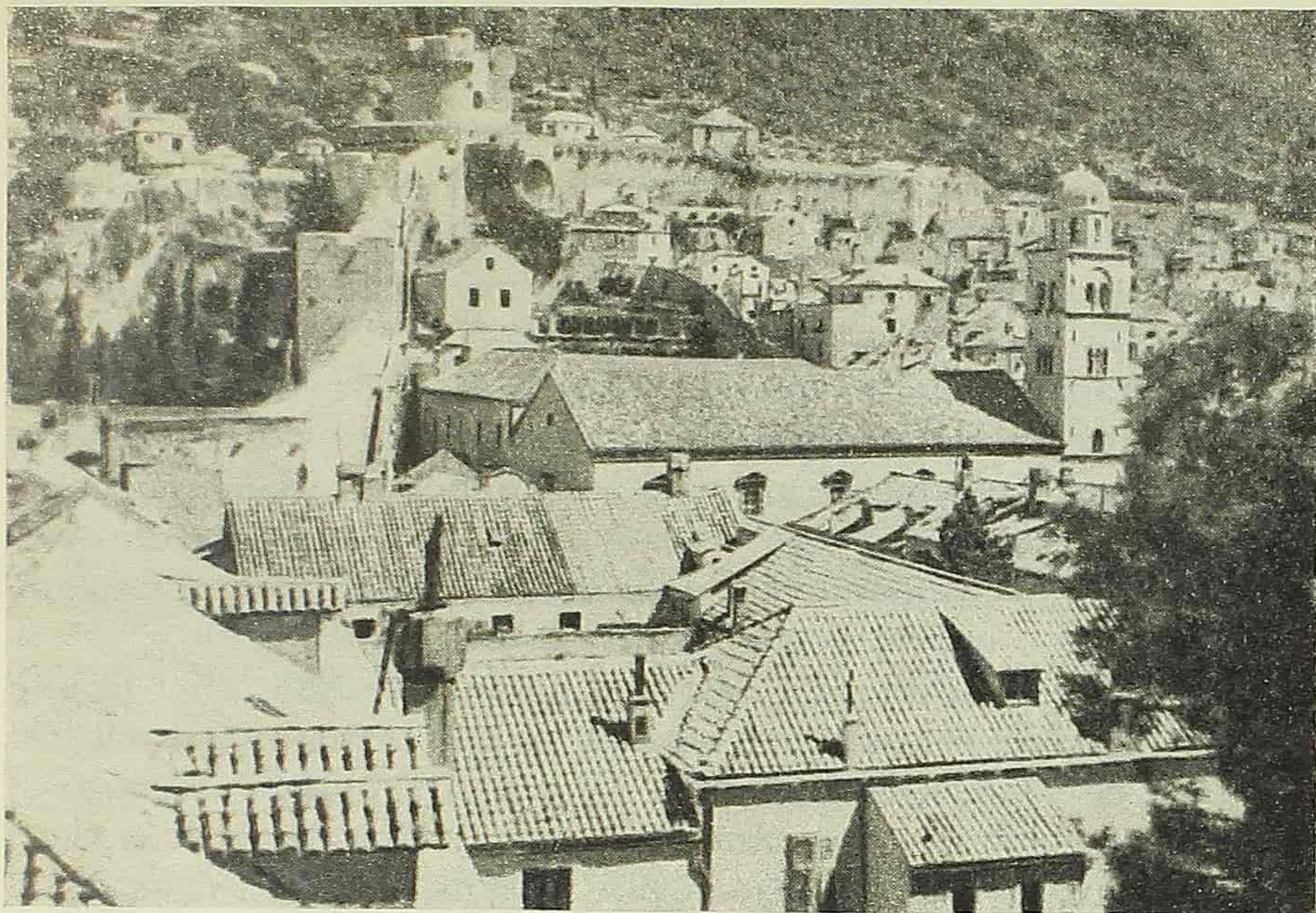
Dubrovnik, pogled na sjeverni dio grada