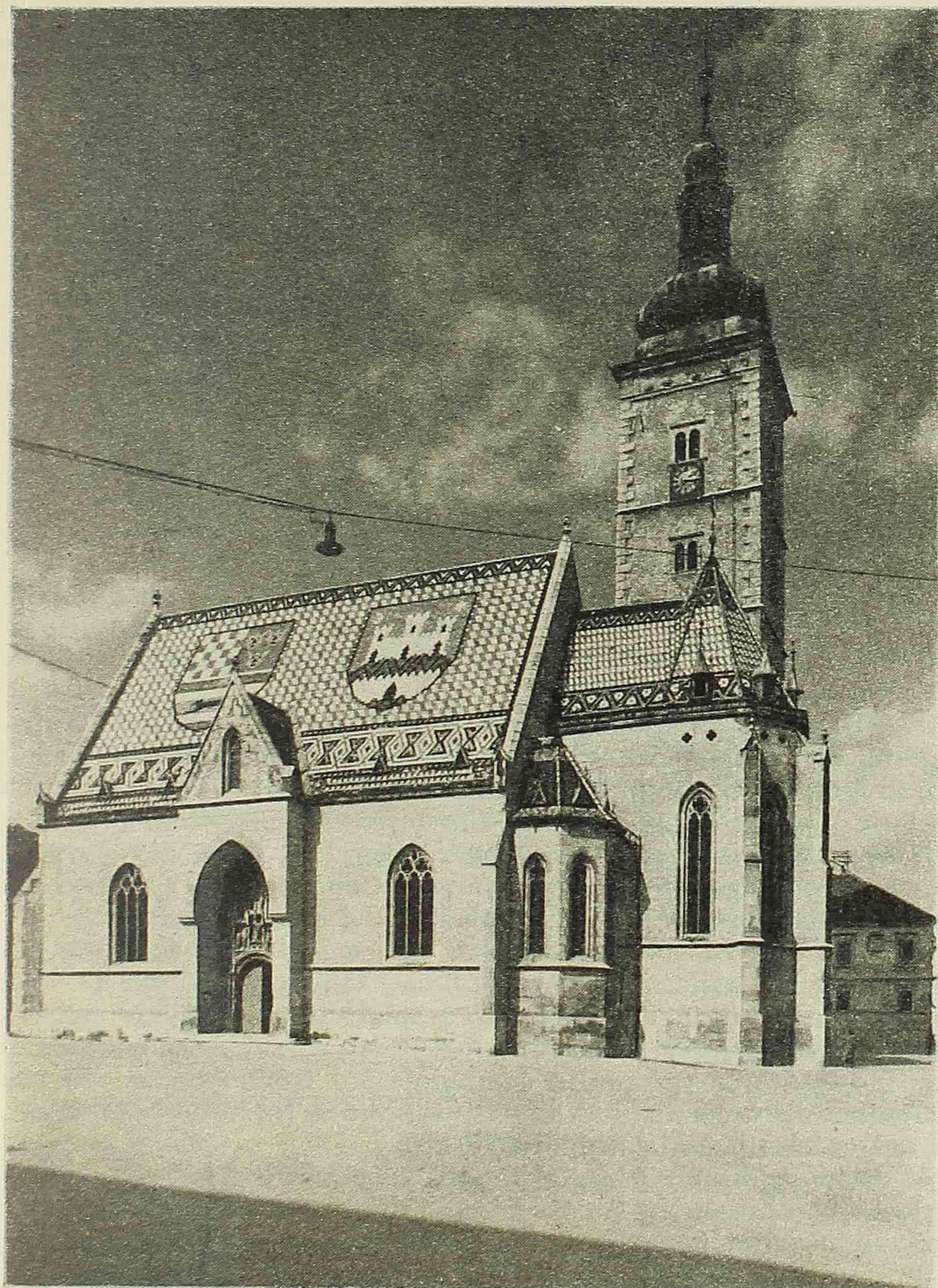
Crkva sv. Marka sa najstarijim zagrebačkim kulturnim spomenicima

NE ZABORAVIMO DA JE 4 i 5 MAJA 1940 GOD. NAŠA DISTRIKTNA KONFERENCIJA U ZAGREBU.