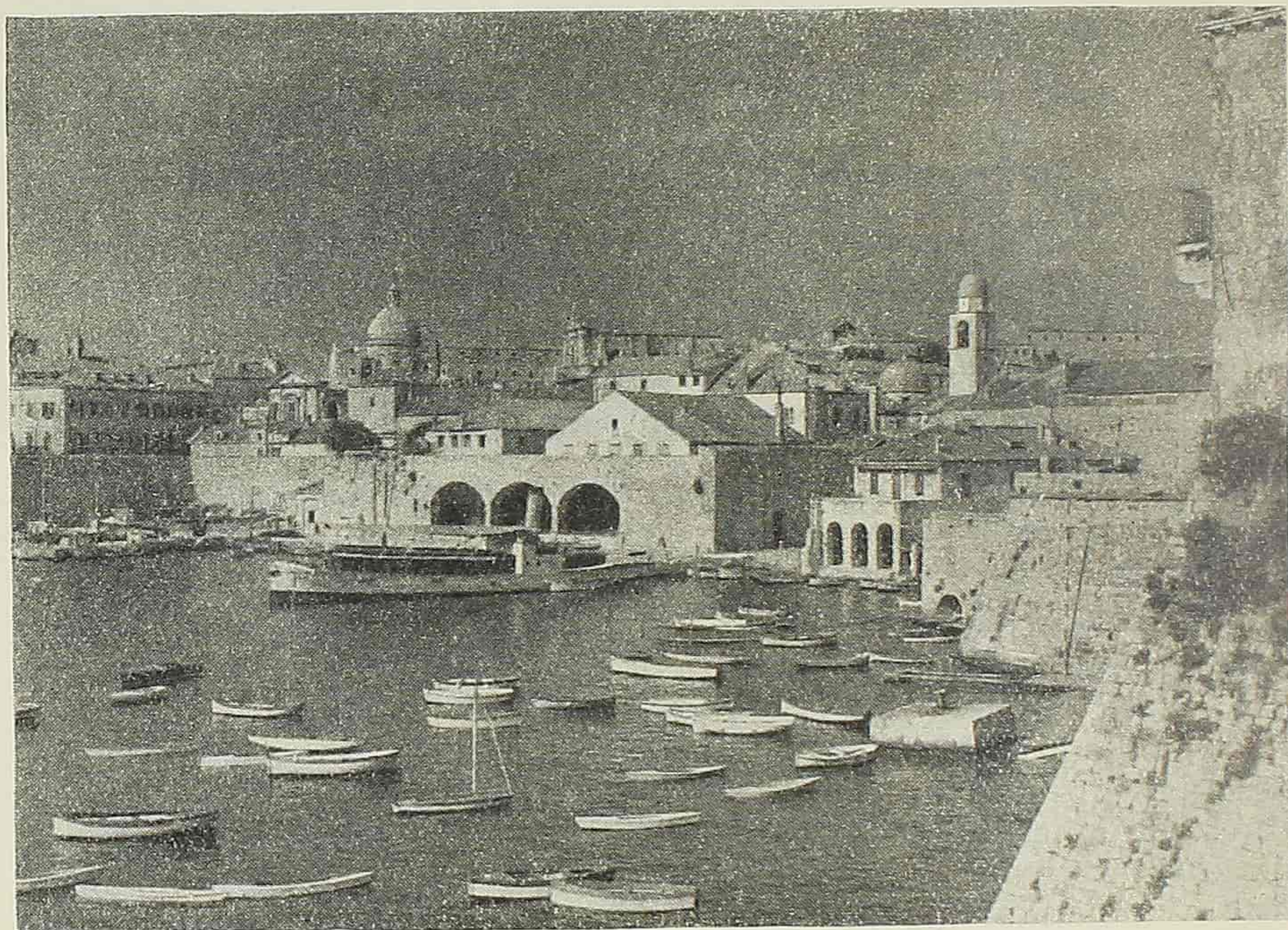
Dubrovnik, gradska luka

Nedavno je, obzirom na dubrovačku luku, u »Glasniku udruženja trgovaca za grad i srez Dubrovnik« učinjena ova konstatacija: »što se tiče same strukture gruške luke u nautičkom pogledu, mislimo da je suvišno iznositi njezine prednosti, kad se ima pred očima poznata činjenica da je gruška luka naša najbolja prirodna luka na Primorju koja svojim geografskim smještajem, zaštićenošću od vjetrova, morskom dubinom i velikom mogućnošću dalje izgradnje u pravcu Dubrovačke Rijeke, pruža ovoj državi i njezinoj privredi sve koristi i mogućnosti koje se mogu očekivati od jedne takove luke.«