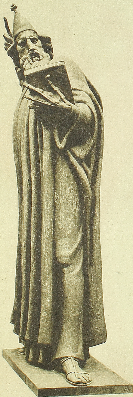
I. MEŠTROVIĆ, „GRGUR NINSKI“