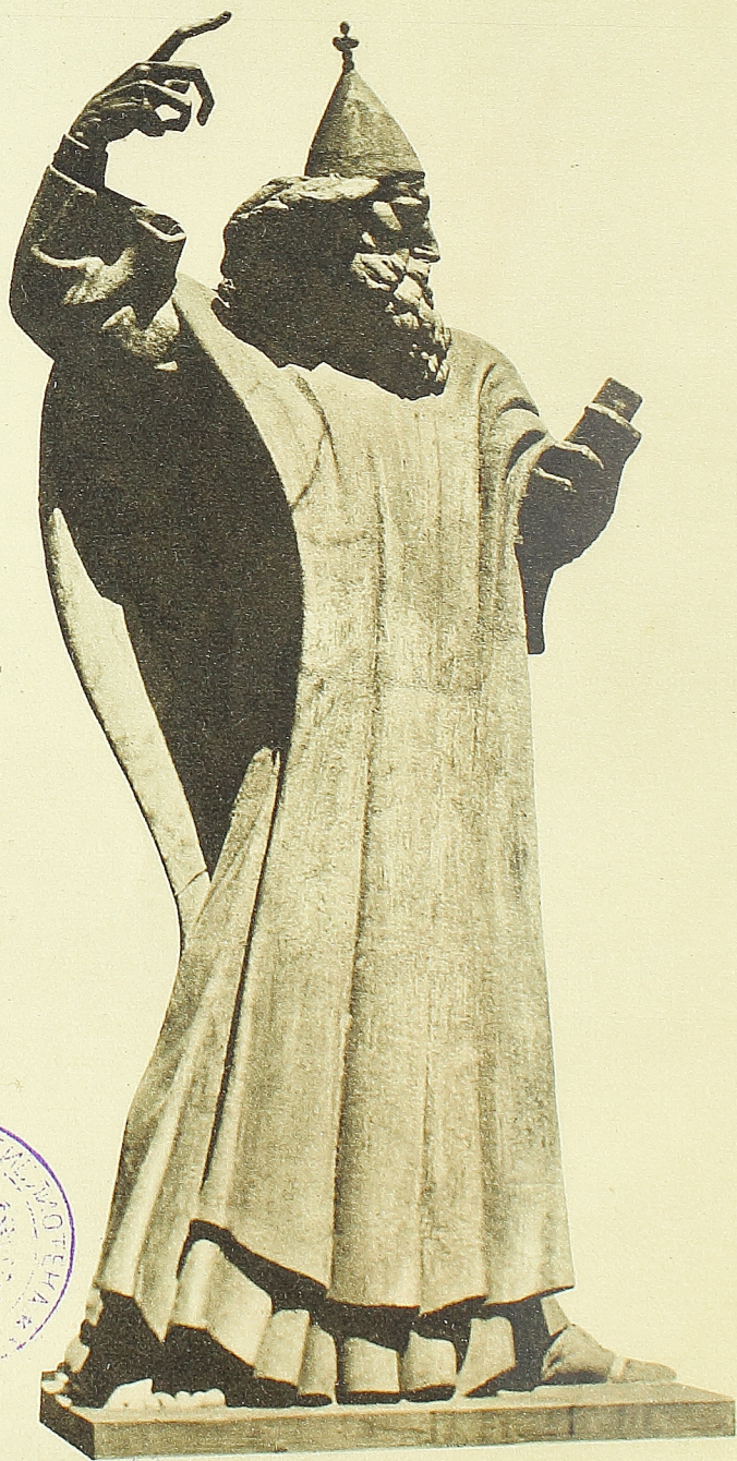
I. MEŠTROVIĆ, „GRGUR NINSKI” (PROFIL)