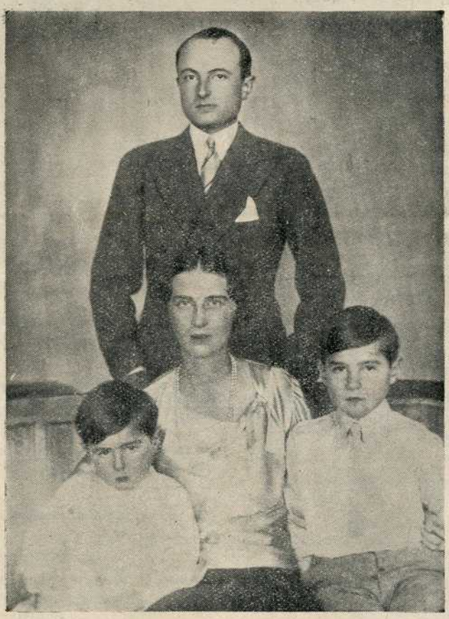
Њ. Кр. Вис. Кнез-Намесник Павле, Њ. Кр. Вис. Кнегиња Олга, Њ. Њ. Кр. Вис. Кнежевићи Александар и Никола

Седмог априла 1936 године у 6'30 часова ујутру Дом Њ. Кр. Вис. Кнеза-Намесника Павла озарен је радошћу новорођењем Принцезе, која је на знамењу добила име Марина.