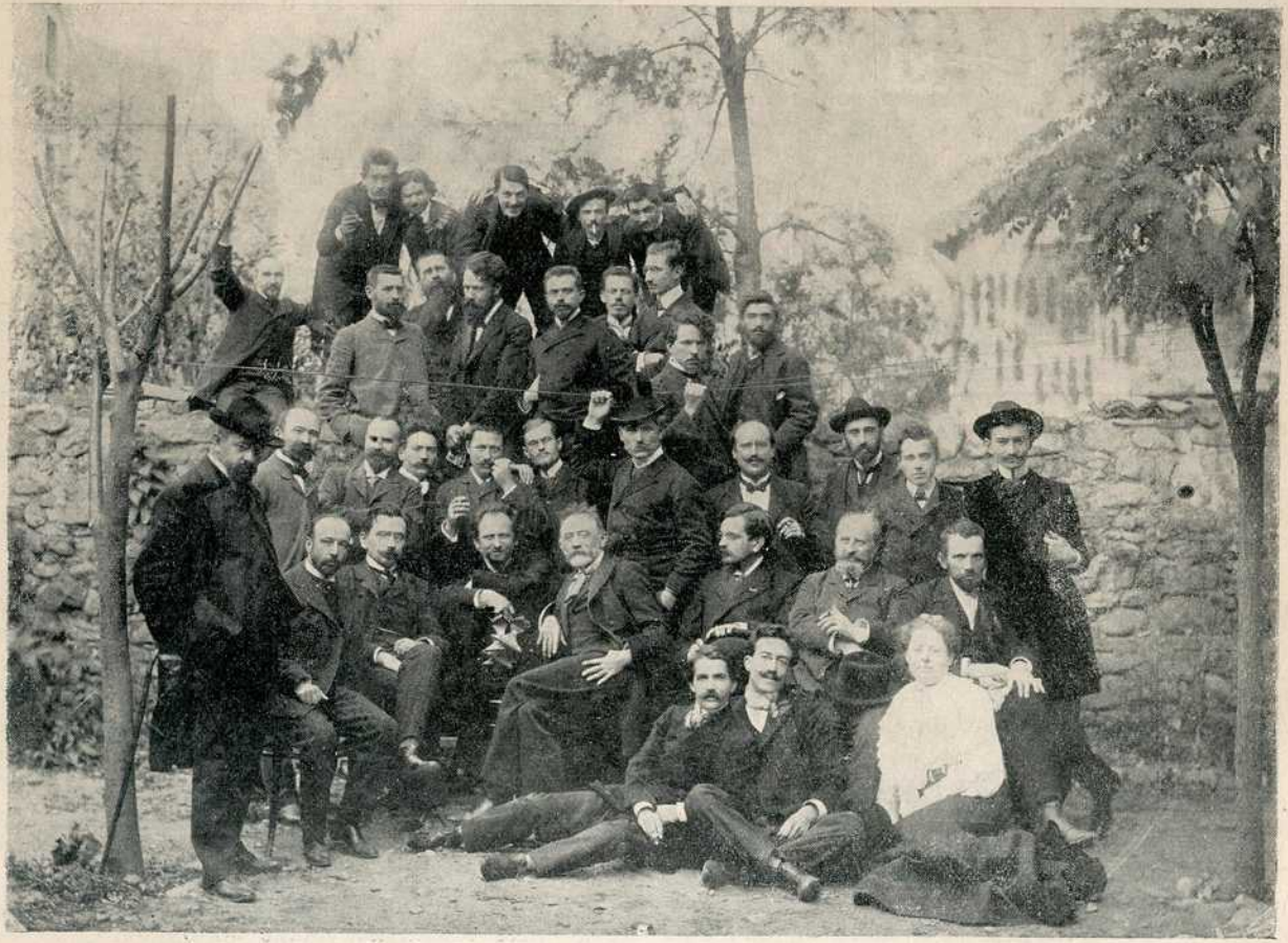
Југословенски уметници, књижевници и новинари снимљени приликом изложбе „Ладе“ у Софији 1906 год.

тику и дубоки унутрашњи значај ствари које описује, Zweig је изложио вредност ове посебне врсте колекционирања, која је тако дуго била занемаривана, да нам од целог низа великих писаца, као Шекспира и других, није ништа остало.