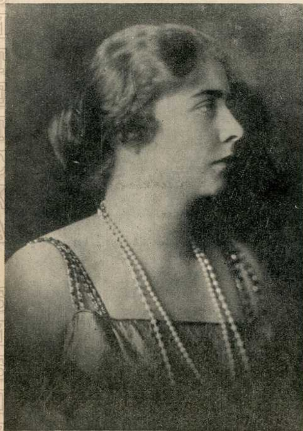
Њено Величанство Краљица Марија

„Узорна и светла, и у свему другом — Румунију памти, чувај љубав њену! Нек Те срећа прати на Твом путу дугом! „Живела нам! Збогом!“... И лађа се крену. За Њом народ кличе: „Зар Ти није жао Букурешта града и цветне Синаје?... — „Жао Ми, али идем! Јер судба је јака! Мене чека срећа, од сад нераздвојна, „У Србији лепој, на обали Саве, На витешким грудма Мог Краљевског Војна! — „Жао Ми, али идем! Јер судба је јака! „Полазим о, Боже, пут Ми благослови! У земљи слободе, песме и јунака!