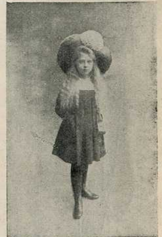
Њ. В. Краљица Марија од 9 година

Краљица Марија као мајка дубоко је осећајна за сву југословенску децу. Њено писмо упућено „Југословенској Унији за заштиту деце“ из Београда 10 новембра 1935 год. бриљантно нам показује ту љубав и осећајност.