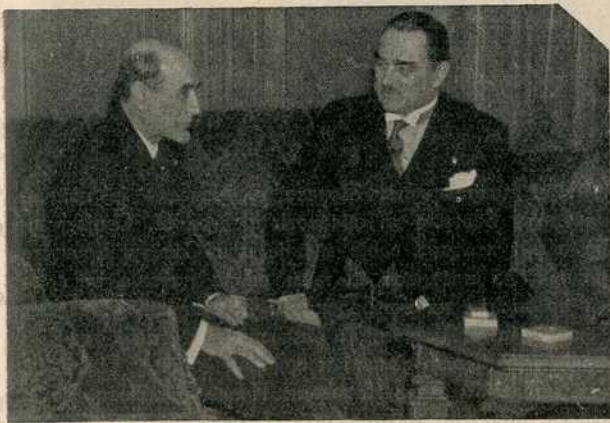
Г. Мическу и г. д-р Милан Стојадиновић, у пријатељском разговору

Румунски Министар иностраних дела г. Истрате Мическу, на путу за Женеву, посетио је Београд 11 јануара о. г. Господин Мическу, који је постао Министар у новој влади г. Гоге, посетио је прво Праг, где је са одговорним чехословачким државницима претресао најактуелније спољно-политичке проблеме и подвукао да ће нова румунска влада продужити политику својих претходника, која је тежила што већем учвршћењу Мале антанте.