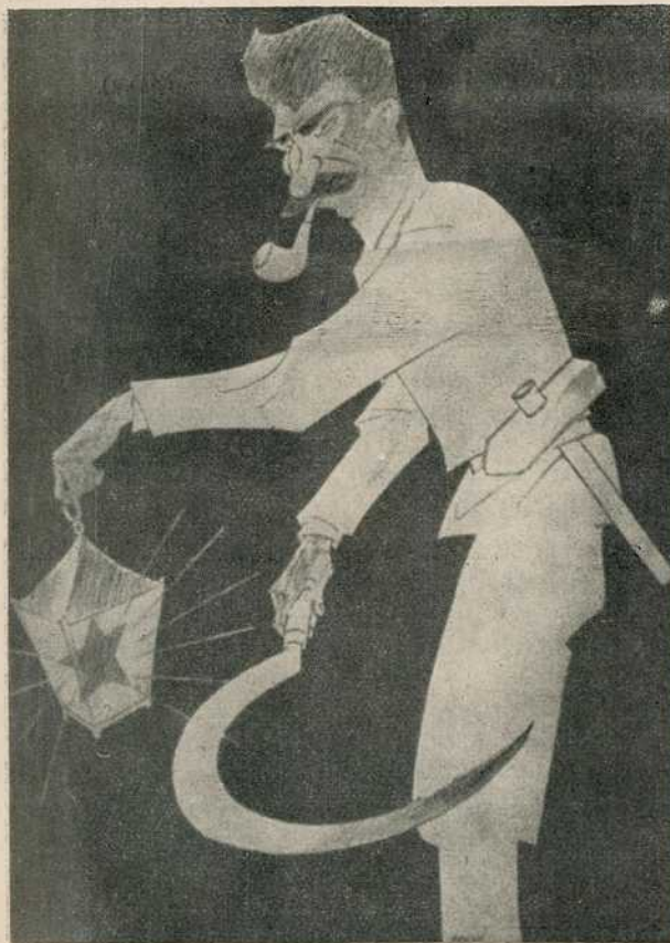
Рајко Алексијев: „Диоген московски: Да ли је још гдегод заостао који правоверни бољшевик, да га пошаљем у чистиште?”

Изложбу су посетили и Њ. Кр. Вис. Кнез-Намесник Павле, претседник владе г. д-р Милан Стојадиновић, министар саобраћаја г. д-р Мехмед Спахо, као и још неколико министара, и велики број грађана.