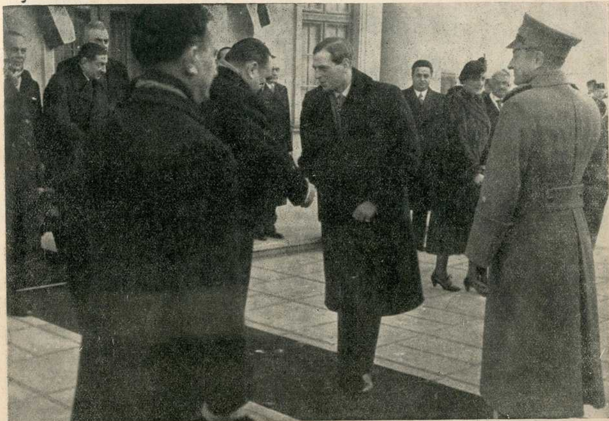
Њ. Кр. Вис. Кнез-Намесник Павле, претседник Краљевске владе г. д-р Милан Стојадиновић и чланови Владе испраћају Њ. Кр. Вис. Војводу и Војвоткињу од Кента на железничкој станици у Топчидеру на пут за Атину

После подне истог дана отпутовали су високи гости за Атину.