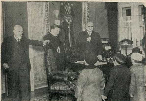
Бадње вече у кабинету председника Општине: Деца из обданишта „Мајке Јевросиме“ поздрављају председника Општине г. Владу Илића

Бадњак су дочекали око 15 1 / 2 часова у кабинету председника Београдске општине: председник Општине г. Влада Илић, градски већници и виши чиновници Београдске општине, са извесним бројем грађана. Г. Влада Илић посуо је бадњачаре житом и бонбонама из једног сита.