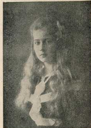
Њ. В. Краљица Марија од 10 година Њ. В. Краљица Марија од 15 година

Ја поздрављам Југословенску лигу против туберкулозе — ценећи њене напоре и њен рад у сузбијању туберкулозе у народу“.