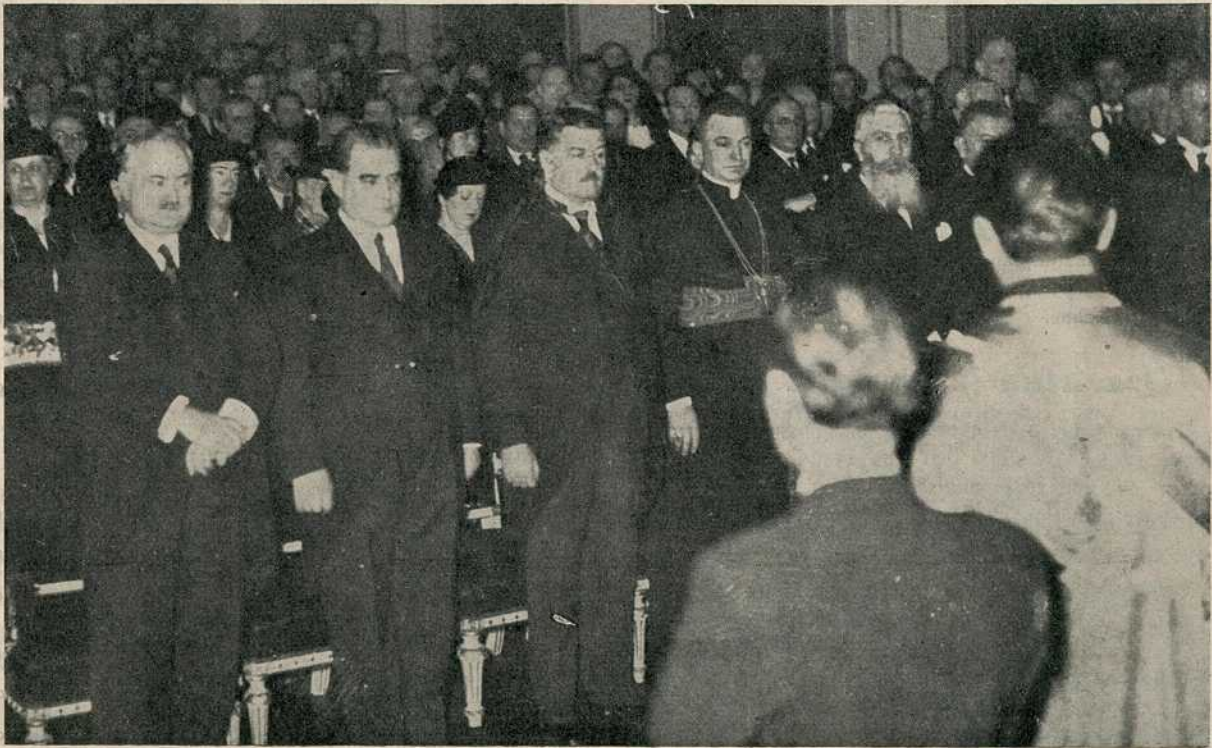
Са прославе св. Саве на Универзитету

бин г. д-р Алкалај и представник старокатоличке цркве г. д-р Нико Калођера. Затим претседник Београдске општине г. Влада Илић; министар просвете г. Димитрије Магарашевић, командант града Београда армиски генерал г. Петар Косић; гувернер Њ. В. Краља г. Јеремија Живановић; потпретседник Сената г. Томић; потпретседник Народне скупштине г. Фрања Маркић, као и већи број претставника страних посланстава на нашем двору.