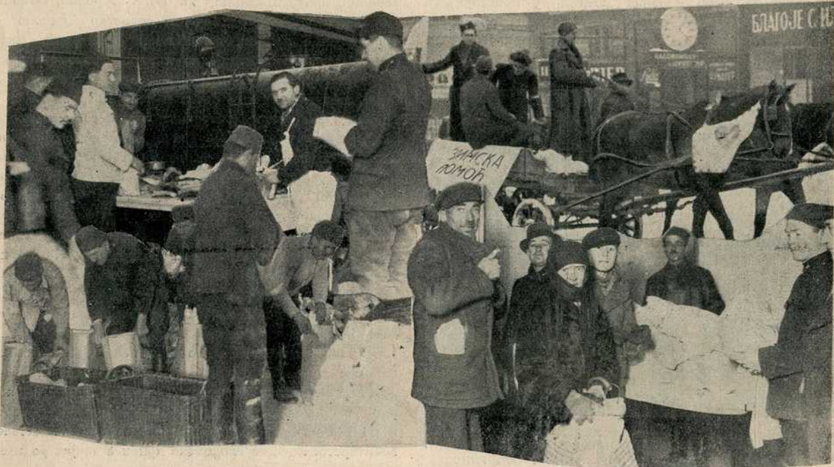
Прикупљање и дељење зимске помоћи пред Божић 1937 год.

— У овим кухињама дели се просечно свакога дана око 4.000 оброка топле хране са хлебом сиромашном грађанству. —