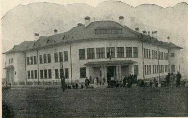
Нова основна школа „Матија Бан“ на Бановом Брду

На крају морамо истаћи велике заслуге вредног друштва „Напредак“, које већ неколико година са успехом неуморно ради на улепшавању овога најстаријег