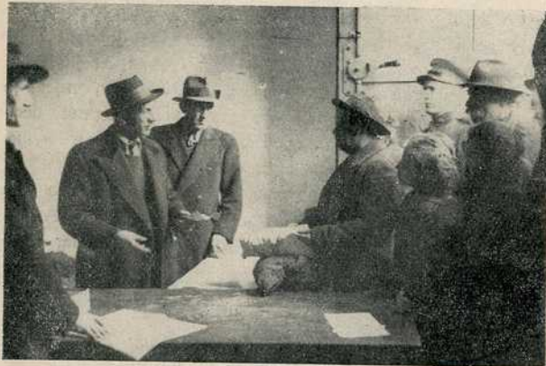
Дељење помоћи у оделу и обући

са животним намирницама, тако да је 3.200 породица на Божић могло да изнесе на сто бољу храну.