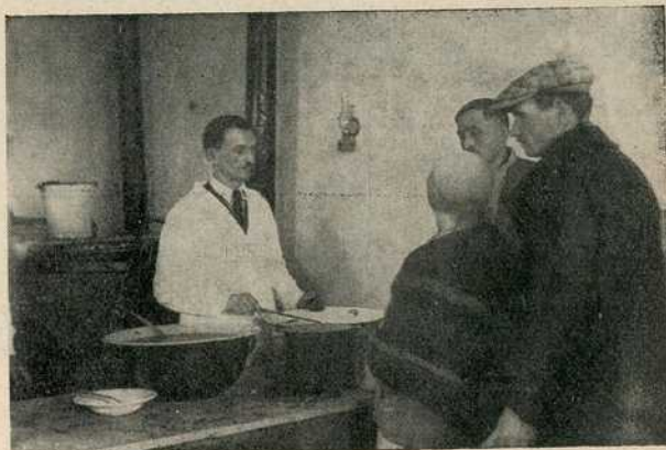
Издавање хране у кухињи бр. 4 на Чукарици

Како се у Београду сваког дана пријављује све већи број сиромашног света за зимску помоћ, то Акциони одбор ради на томе да се отвори још једна, пета кухиња.