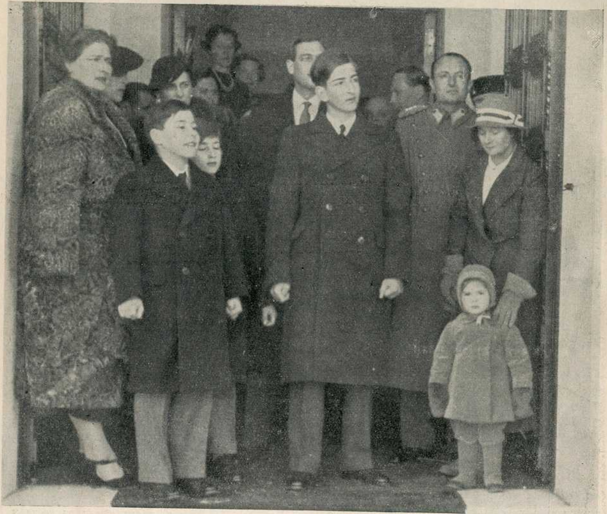
Њ. В. Краљ Петар II, Њ. В. Краљица Марија, Њ. Кр. Вис. Кнез-Намесник Павле, Њ. Кр. Вис. Кнегиња Олга, са члановима Краљевског Дома и Њ. Кр. Вис. Војводом и Војвоткињом од Кента очекују бадњак у Двору на Дедињу