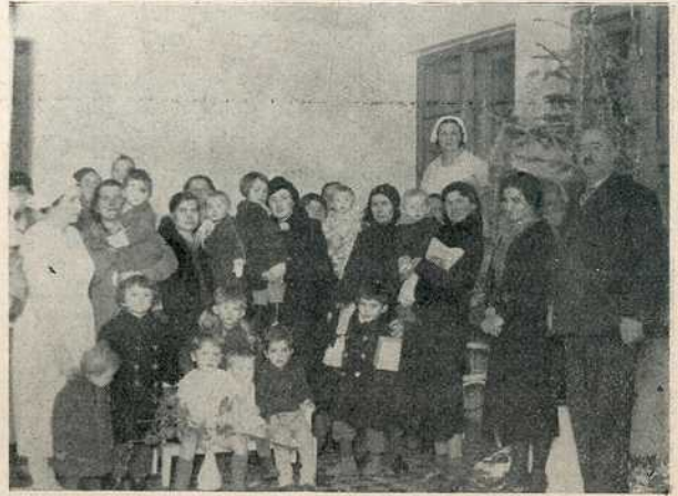
Бадње вече у радничком обданишту.

поздрављам и желим вам да лепо проведете Божићне празнике.”