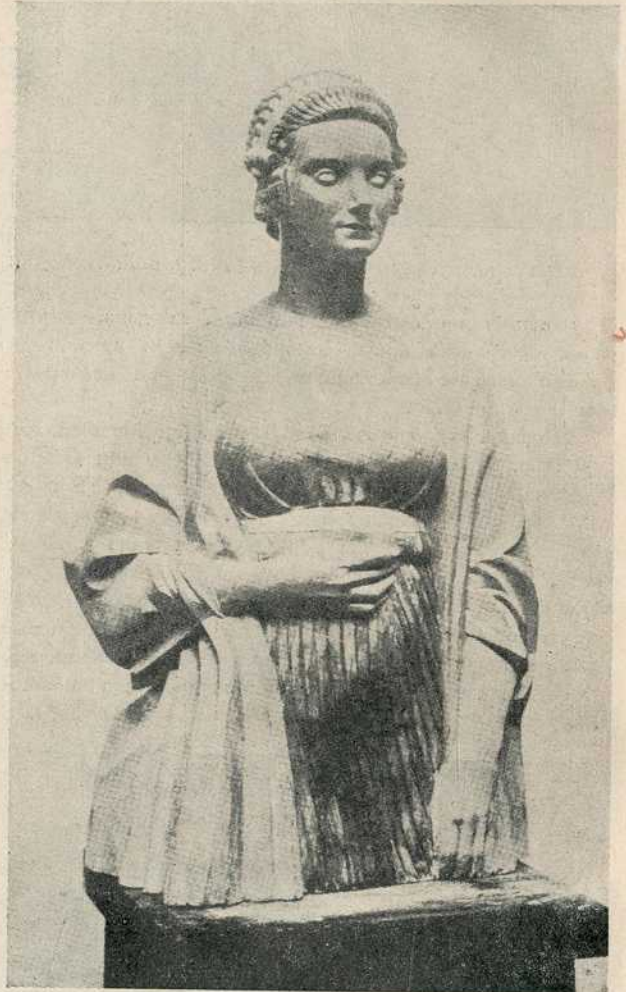
Кс. Дуњиковски: „Портрет Американке“ (Са изложбе пољске уметности у Музеју Кнеза Павла)

жаве, Београдске општине, разних београдских установа, хуманих друштава и милосрдног грађанства — сваке године све више проширује своју корисну делатност, без које би хиљаде сиромашних грађана Београда морали да осете све недаће које доноси зима и њени оштри мразеви.