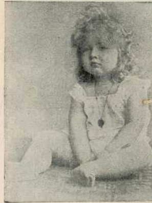
Њ. В. Краљица Марија од 2 године

Нека ни једно југословенско дете не остане незбринато, незаштићено, нека сва наша деца весело живе и напредују и нека се њихова дечја песма среће разлиже по свима крајевима дивне Југославије.“