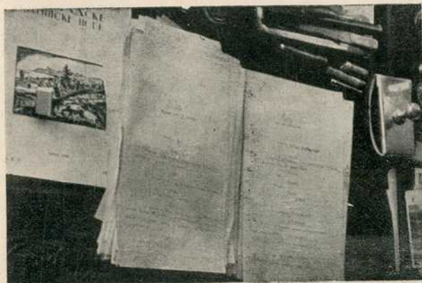
Пок. Нушић је до последњег дана радио. На његовом писаћем столу виде се „Београдске општинске новине” поред рукописа његове последње драме

Карактеристично је да је пок. Нушић и у последњим својим часовима показивао широко интересовање за све проблеме. Он је редовно пратио наше „Београдске општинске новине”. На његовом столу, поред рукописа последњег његовог дела, на коме је радио го-