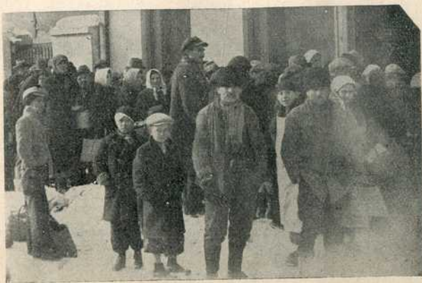
Пред кујном Зимске помоћи у ул. Старца Вујадина на дан отварања ове кухиње

У свима овим кухињама сада се дели 3.910 оброка