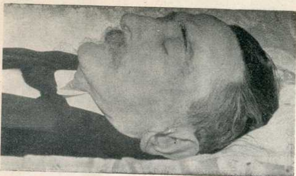
Бранислав Нушић на одру

Познати наш књижевник, приповедач и драматичар, духовити Бранислав Нушић умро је 19 јануара у 12 и по часова у 74 години живота.