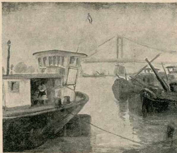
А. Балаж: На савској обали