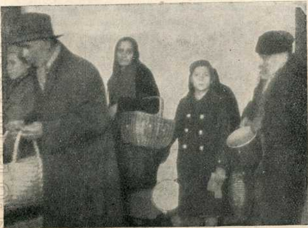
У чекаоници кујне бр. 1 у улици Милоша Поцерца

је у акцију на сам Бадњи дан. Тога дана, у три разна београдска краја, отворене су три кухиње за дељење исхране сиромашном, немоћном и незапосленим грађанству.