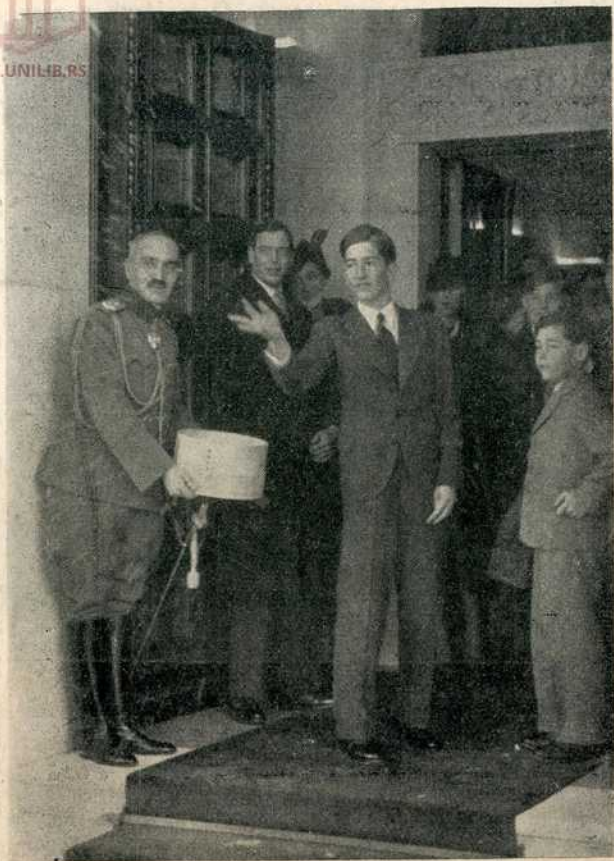
Њ. В. Краљ Петар II посипа бадњачаре житом

ца. Затим су сви носиоци бадњака послужени врућом ракијом, по старинском народном обичају.