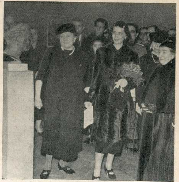
Њ. Кр. Вис. Кнегиња Олга на изложби жена-уметника Мале антанте

Г-ђа Пламинкова је са неколико топлих речи поздравила Кнегињу Олгу и предала Јој букет цвећа.