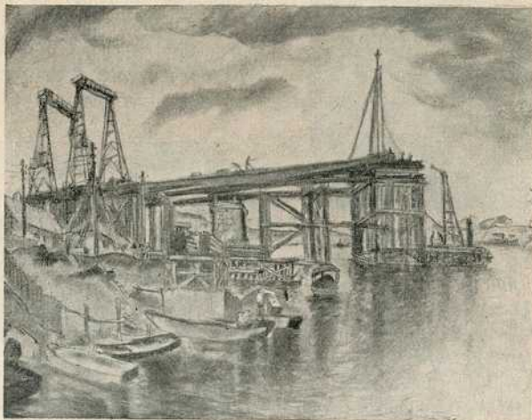
А. Балаж: Грађење Земунског моста

После парастоса, око подне ,формирана је поворка од свештеника и народа у црквеној порти, која је прошла кроз град преко Теразија до зграде Патријаршије певајући „Ускликнимо с љубављу Светитељу Сави!“