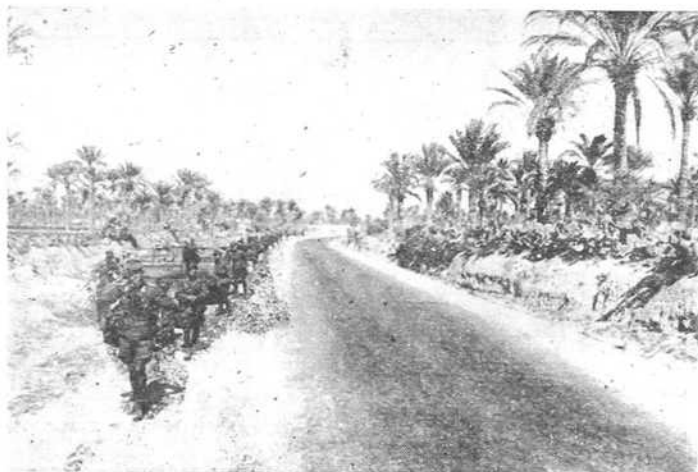
Немачке моторизоване колоне на афричким друмовима

Берлин, 17 маја (ДНБ) Врховна команда државне оружане силе саопштава: Једна подморница којом командује поручник бојног брода г. Шеве, јавља да је потопила пет британских трговачких бродова са укупно 33.612 тона.