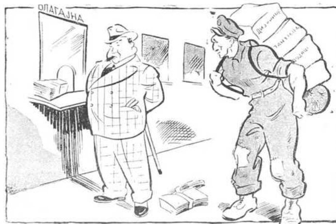
Бивши министар пред шалтером Српске народне банке