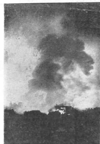
После посете немачких бомбардера огромни пожари осветљавају Лондон

рице велики адмирал Редер, увео је ратну медаљу за посаду брзих јуришних чамаца. Ова медаља може