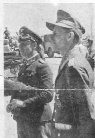
Командант Немачког афричког корпуса, генерал Ромел са погинулим генералмајором Притвицом пред Тобруком

У времену од 13 до 16 јуна непријатељ је изгубио укупно 53 авиона. Од овог укупног броја, 48 авиона о-