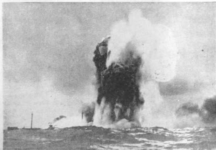
мени стубови на Атлантику. Енглески брод потопљен торпедом подморнице

У Источној Африци, у области Гале и Сидама, настављени су предвиђени покрети наших колона, ометани рђавим временом. На другим отсесима није било нових догађаја.