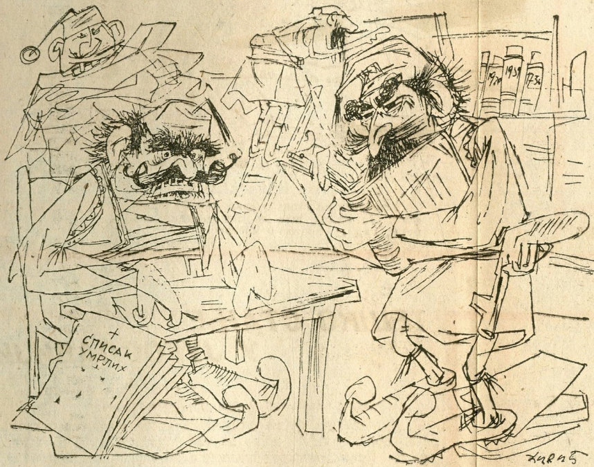
— Отвори четвере очи — прошли пут су нам се увукли и неки живи у спискове!

У Грчкој је извршена супер-ревизија бирачких спискава,