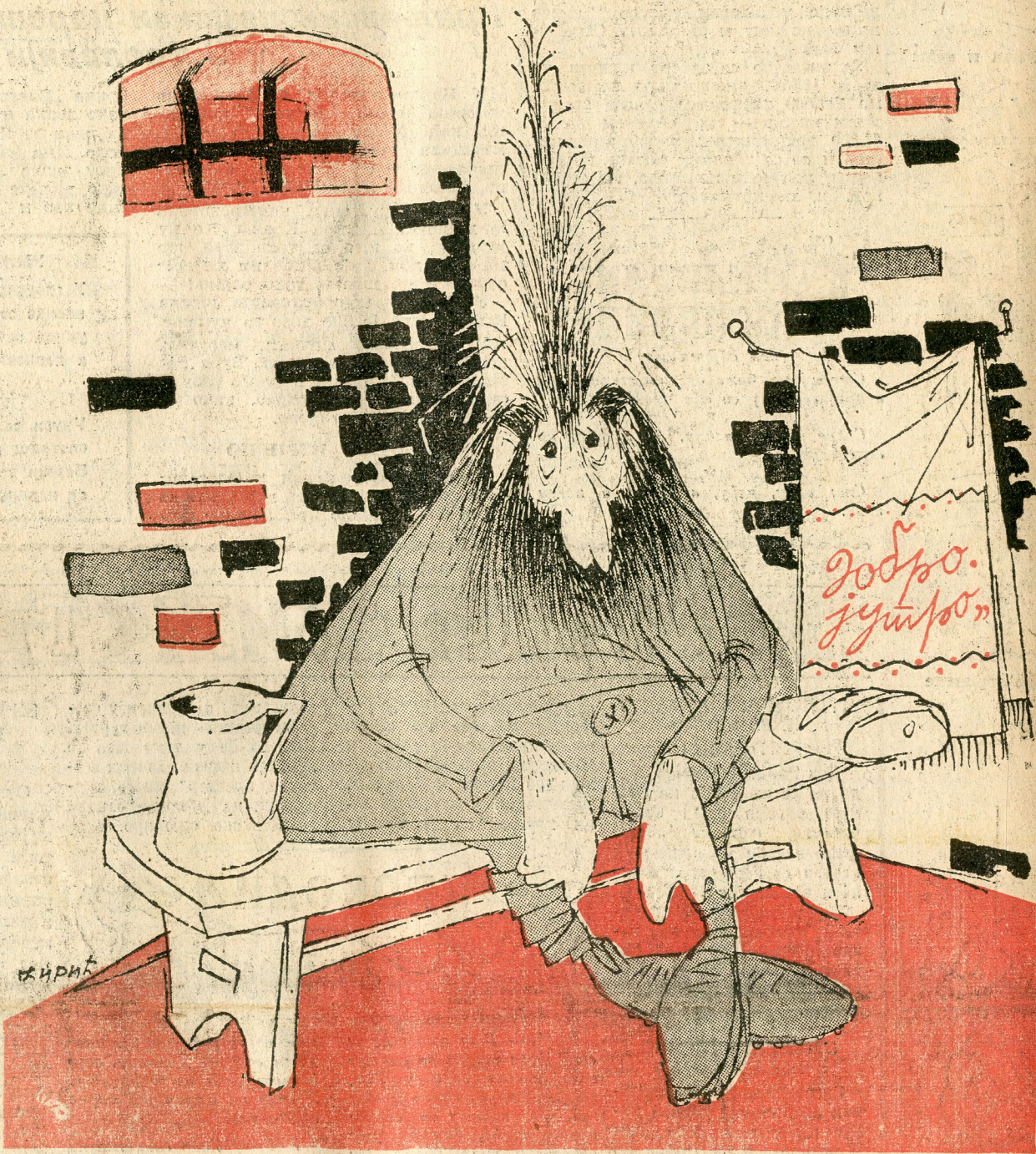
— Е сад ми је без оних компаса ситуација најјаснија.

Дражи Михаиловићу приликом хапшења одузели су 5 компаса.