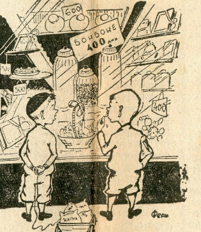
— Ови ће добро зарађивати ако буду куповали код „На-Ме“ бонбоне.

„На-Ма“ продаје бонбоне по 150 и 170 дина, кизограм, док се на другим местима продају по 400 динара кизограм.