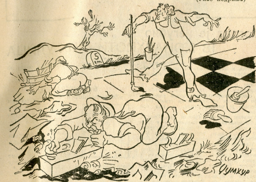
...акцији улепшавања Шаца.

у Шацу столари чисте улице а молери оправљају путеве. (Глас подриња)