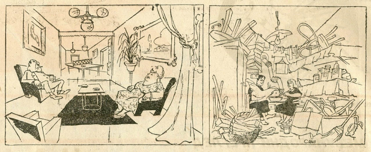
— Немамо места ни госте да примимо! — Кад би имали где ову корпу са дрвима да смештимо било би нам комотно!