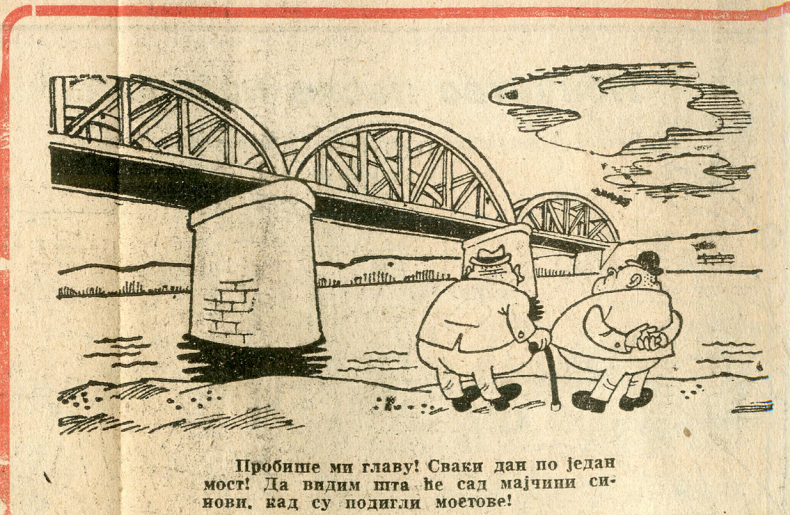
Пробисмо ми главу! Сваки дан по један мост! Да видимо шта ће сад мајчини синови, кад су подигли мостове!