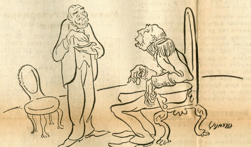
— Да ли Ваше Величанство ускоро намерава да посети бираче? — Врло неукусно питање! Моје Величанство се нада да ће још дуго живети.

Дописник листа „Монд“ интервјуисао је грчког Краља Ђорђа.