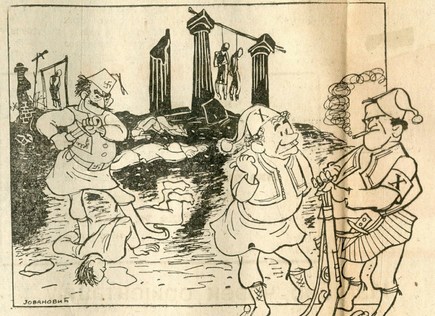
— Зашто овај никад не прекоље жртву до краја, као ми? — Па он је умерени монархиста.

У Грчкој постоје две странке: тзв. крајњи монархисти и „умерени“ монархисти.