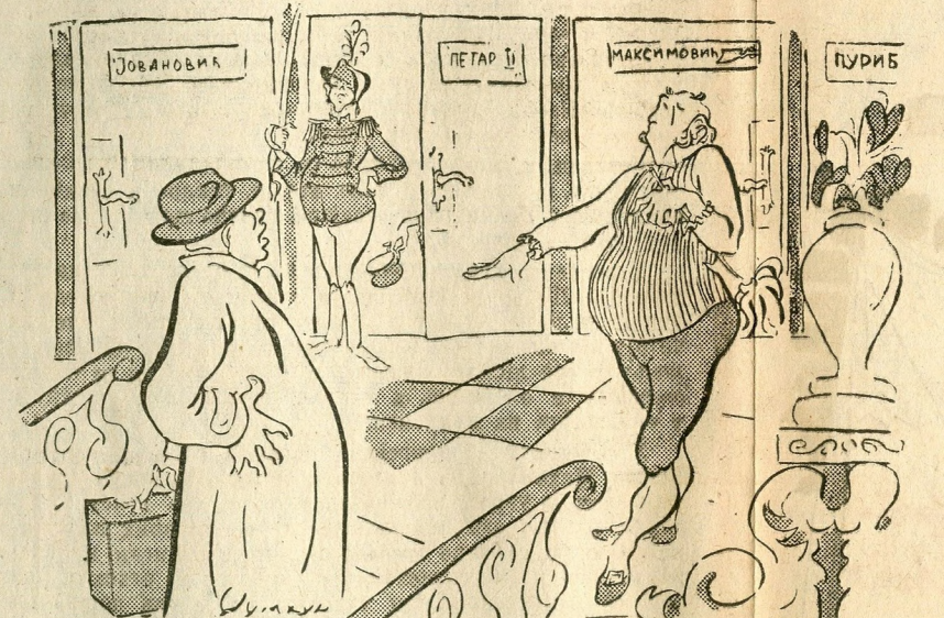
— Повуците се, мистер, пошто је све заузето за познате европске демократе!

Бившем председнику демократске португалске владе ускраћен је боравак у Лондону због несташнице станова,