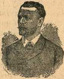
† Сима Матавуљ 1852—1908.

Био је наше горе лист! То је, додуше, прешло већ у заборав, ал' ми нећемо заборавити, јер поред богодана му талента, ту лежи кључ за решење Матавуљева доброг познавања људи и прилика у животу, то је био извор на којем је он захватио ону моћ и језгровитост у изразу, ту је оно богато поље, на којем је могао положити основ својем дубоком психолошком погледу, присвојити богатство слика у језику. У свима његовим причама нема ни једног натегнутог, театралног момента; све је просто, природно, онако како је бог створио, али тако складно, да те осваја за увек. Сви његови типови, од оних у нежном „Анђелу младог љета“, па до Букара у Фра Брну, сви су једнако примамљиви. Таку савршеност може само онај изнети, који прпе на бистром нар двом врелу. А такав рад маме те да га с правим уживањем проучиш не само један пут него и још који пут.