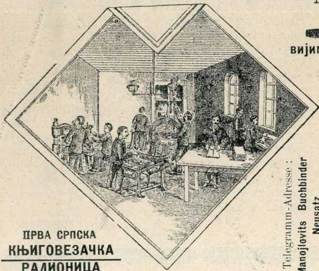
ПРВА СРПСКА КЊИГОВЕЗАЧКА РАДИОНИЦА

Цене су врло умерене — а налози у опште обављају се брзо и тачно.