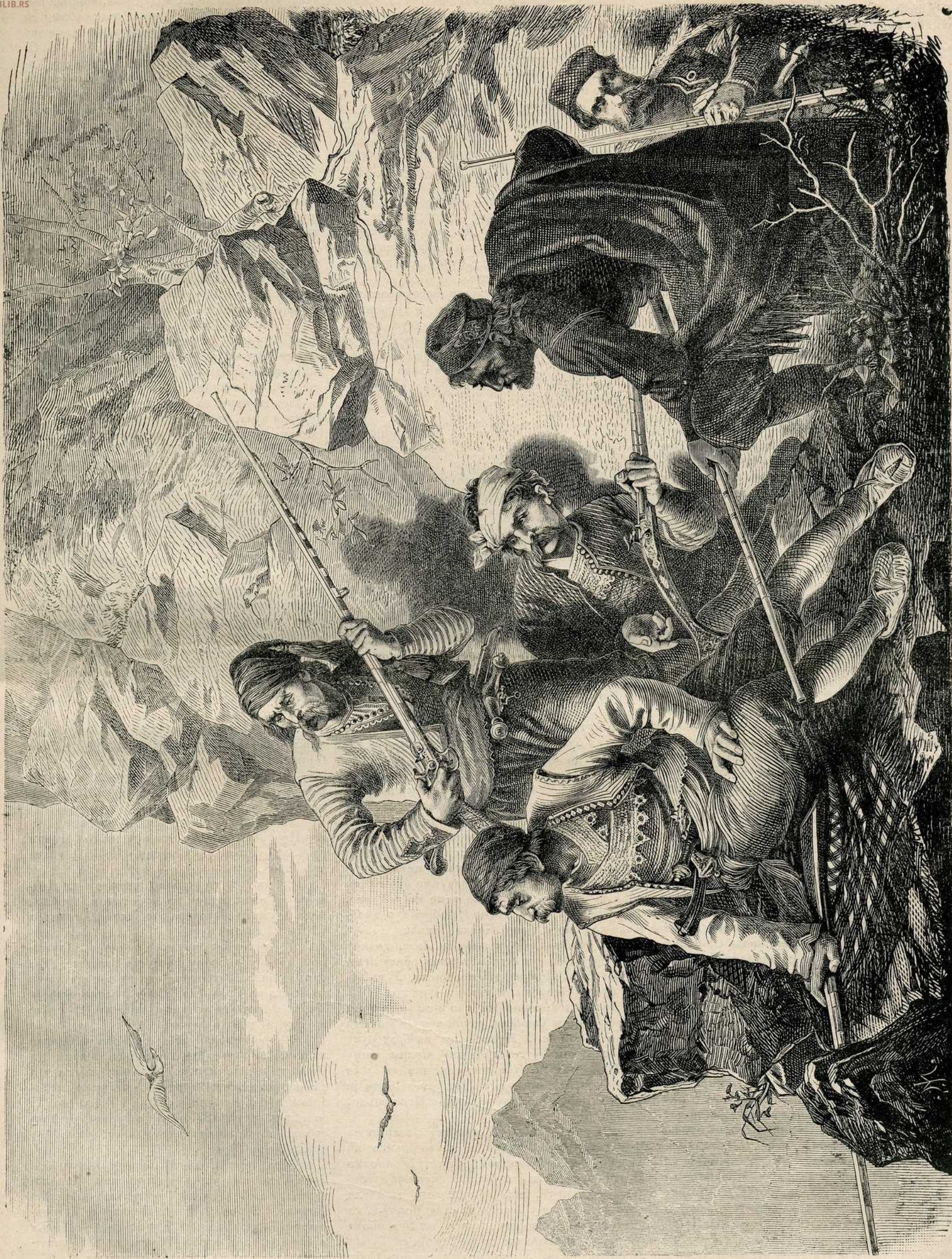
Херцеговци у заседи.