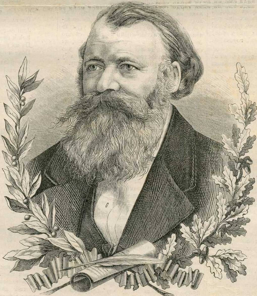
Др. Светозар Милетић.