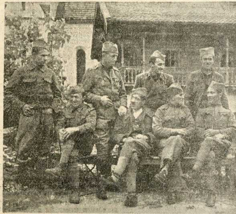
Група српских заробљеника који раде на једном сељачком газдинству у Немачкој