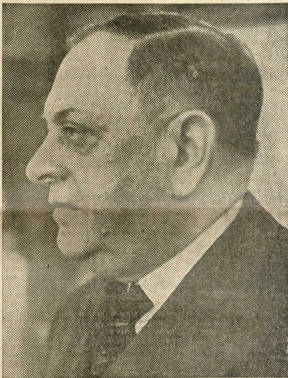
Армиски генерал МИЛАН Б. НЕДИЋ претседник Владе народног спаса

Само после неколико дана велики број највиђенијих грађана наших, са комесарима, позваше ме опет. Стање у земљи било је очајно. У братоубилачким борбама крв се лила на све стране. Претила је опасност да Србија буде подељена међу суседе. Требало је брзо спасавати што се још дало спасти. У тим судбо-