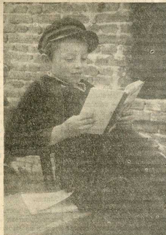
Мало сељаче не проводи више време бесциљно већ чита добре књиге

Како за сада Фонд још не располаже толиком сумом новца да би могао збринати сву талентовану сиромашну децу са села која су ове године завршила основну школу, а не могу да прођу школовање у гимназији, управа Фонда позива да јој се одмах пријаве сви српски имућни привредници и други грађани из целе земље у местима где постоје гимназије, нарочито они који су пореклом са села, а који