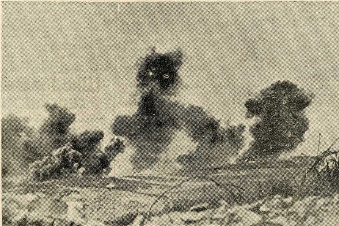
Из првих борбених линија Источног фронта

тељске пропаганде која није жалила лажна обећања како би примамила немачки народ на „чистан мир“. Под дејством те пропаганде у самој Немачкој створио се пацифички фронт, који је био опаснији од свих других фронтова. Немачка вера у победу била је уништена, и зато ступајући у пету годину рата Немачка је наставила борбу без наде у успех. Зато неко-