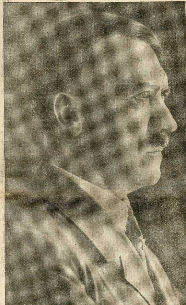
Вођа Немачког Рајха АДОЛФ ХИТЛЕР

Нова епоха у животу српског народа треба да настане од часа када је Вођа Немачког Рајха Адолф Хитлер примио у своме Главном стану Претседника Српске владе, генерала Недића. Био је то тренутак од историског значаја за судбину српског народа, када је његов спасилац могао непосредно, лично да изнесе пред високог чувара и заштитника европске независности жеље и потребе српског народа у садањем његовом положају, до