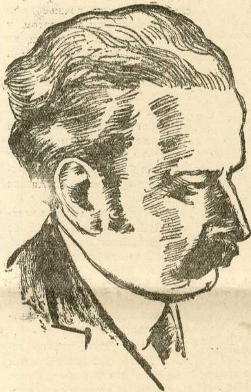
ЕРВИН ГВИДО КОЛБЕНХАЈЕР