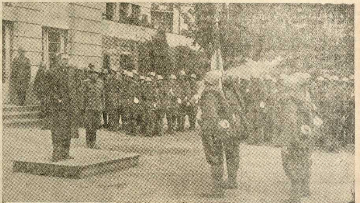
Генерал Недић поздравља добровољце V батаљона

...„Шумадија, у коју одлазите, најплеменитији је део нашег народа. Сва стварања, велике идеје и покрети, потичу из ње. И нова велика Србија одатле ће да се роди. Ви имате дужност да је понесете. Српском народу пружите заштиту и правду, јер је закон највећа сила. Где буде добровољац, да се распростре ред; где буде добровољац, да завлада мир и законитост. А свако ко се дрзне да ради супротно, сматраће се непријатељем. Највећи непријатељи српског народа јесу комунисти. Ели сте Мајку Србију спасли, чувајте је и у будућности живеће она вечно“.