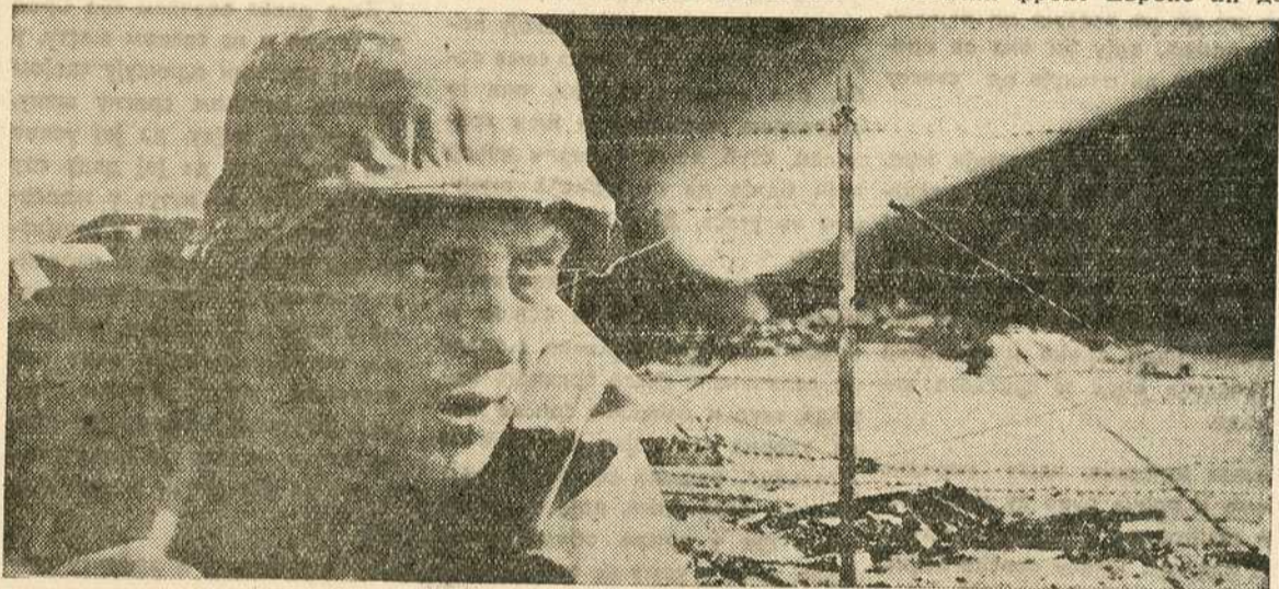
Ноћ у првим борбеним редовима. Претполе је осветљено јаким млазевима светлости рефлектора. Немачки гренадир посматра дејство бачене бомбе у болшевичким редовима

Борбе на Саломонским острвима, као и борбе на Новој Гвинеји претстављају за јапанску стратегију не перифериске догађаје, већ догађаје испред периферије. Зато Јапанци одређују за те борбе минималан број војника. По 2.000 до 3.000 војника бране такве положаје и задржавају Мек Артурово напредовање. Тиме се ствара ситуација која изгледа смешна када се посматра очима Тројног пакта и изгледа трагична када се посматра очима коалиције.