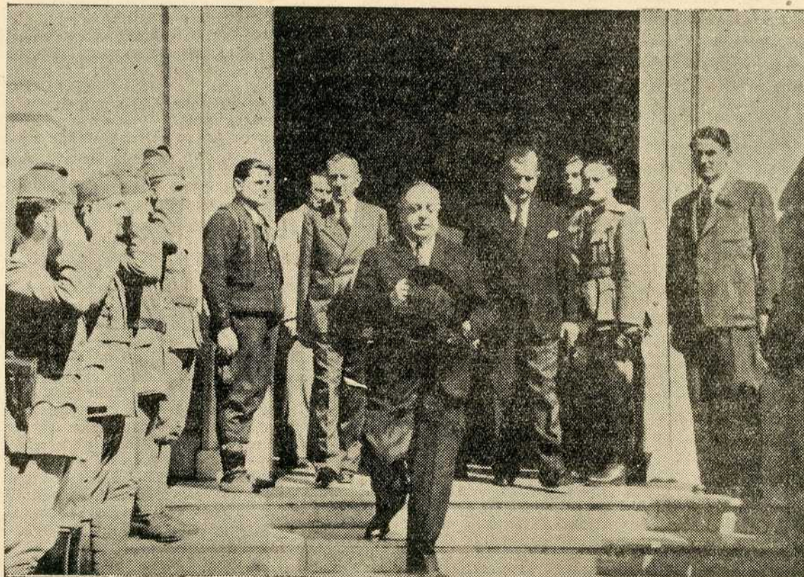
Претседник владе, генерал Недић, излази из Саборне цркве после помена палим српским добровољцима и четницима