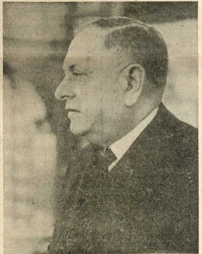
Претседник Српске владе ГЕНЕРАЛ М. Б. НЕДИЋ

Имајући на расположење довољан број бораца за мир и ред у Србији са потребним сретствима, генерал Недић биће у стању да у корену уништи све покушаје рушилаца мира за рачун Лондона и Москве, стварајући од Србије једну непробојну тврђаву у одбранбеном систему Европе.