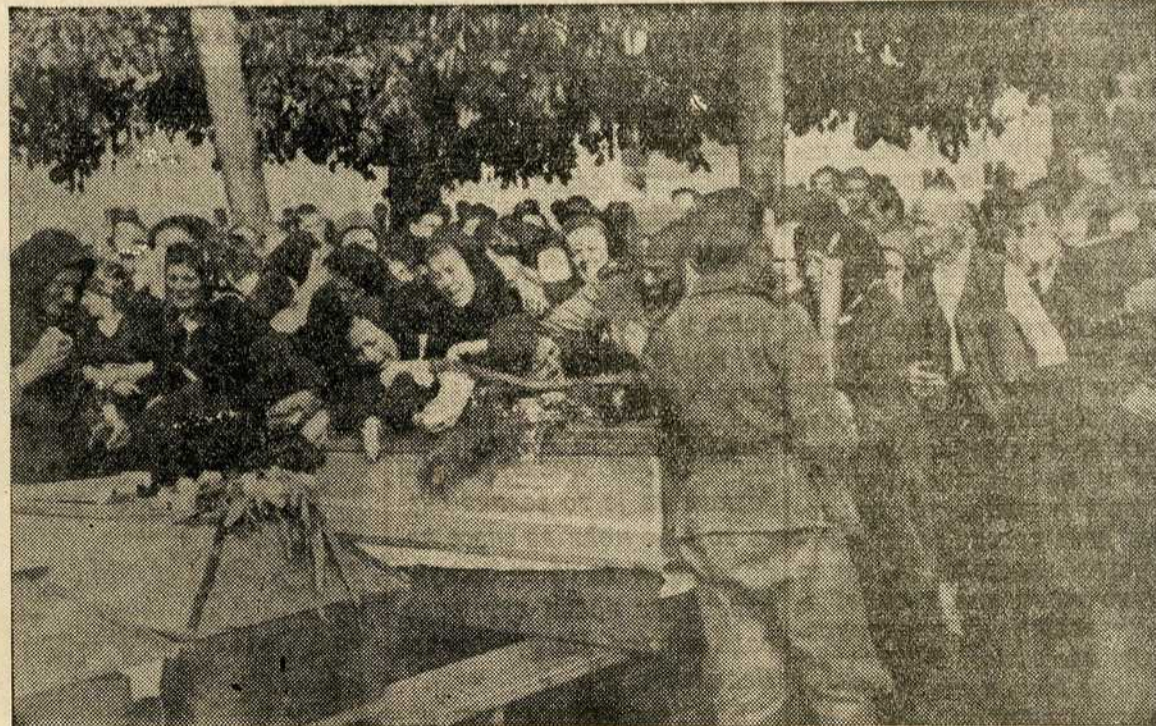
Погреб једног добровољаца