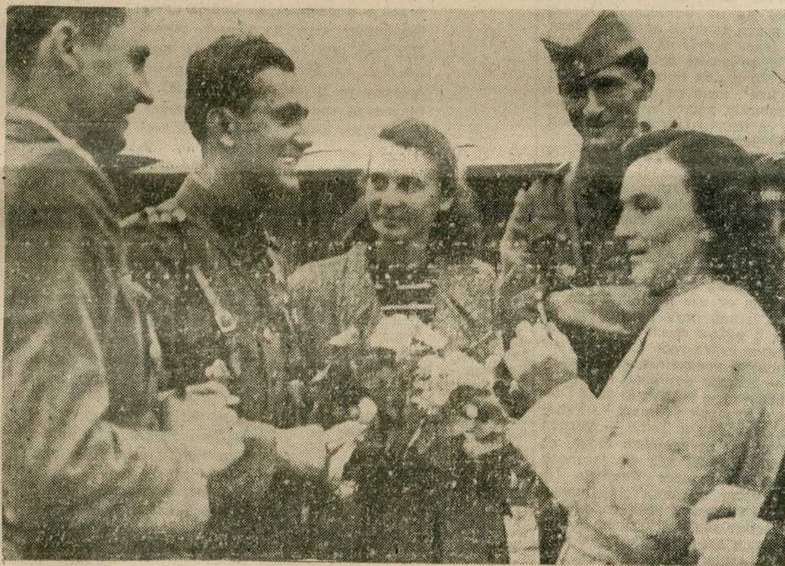
Добровољци су се вратили... Букети цвећа су најбољи знак радости, са којим су их дочекале њихове другарице...

— Напусти досадашњи земље! Кад сам тамо, далеко сам од јазбина смрти, у које су нам савезници престојни град претворили. Кад сам тамо, нема осећања кукавичлука, беспомоћне зевње.