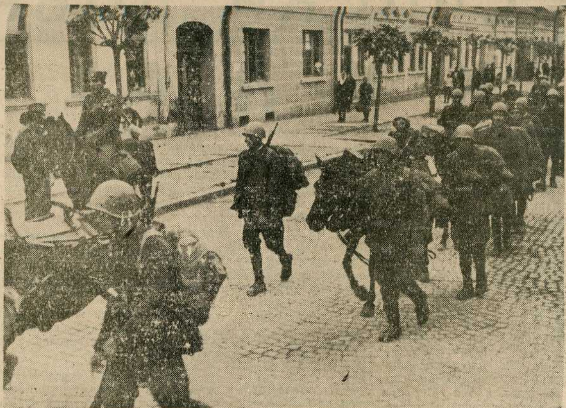
Бацачи граната и митраљесци на повратку из борбе са Брозовим бандитима...

То је она мелодија, народна и сељачка, борбена али и са једном нијансом туге у себи, која