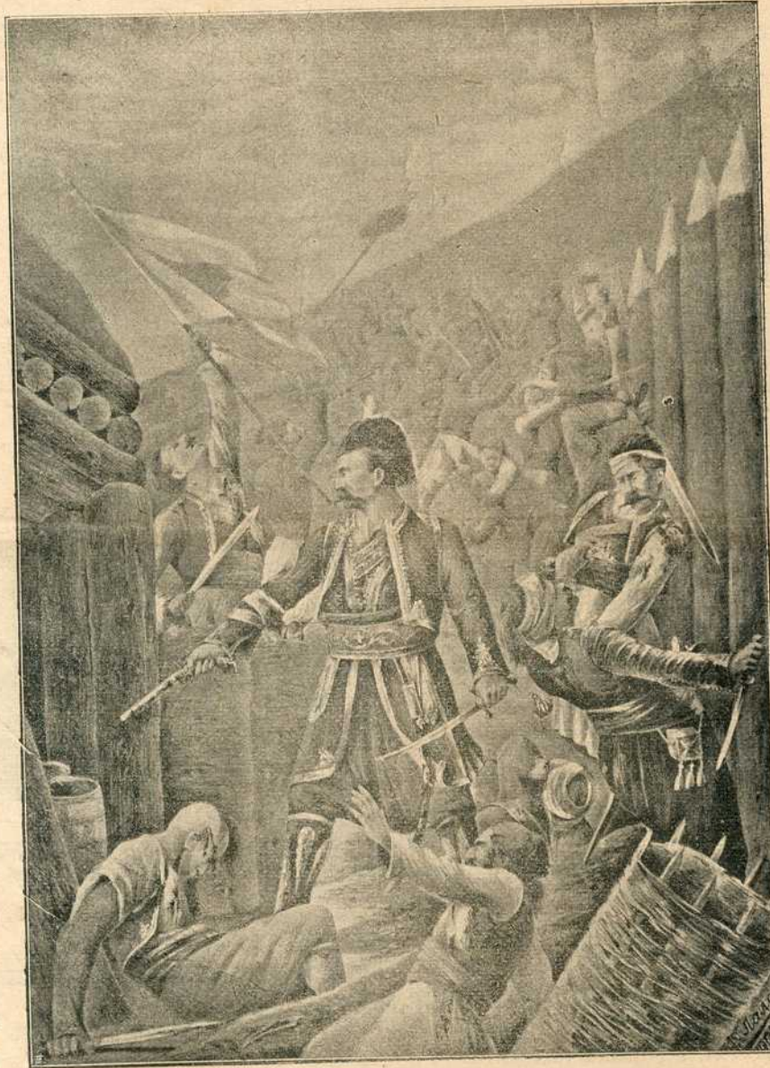
Јуначка смрт војводе Стевана Синђелића.

паша дође под Биоград, он на своје чудо велико нађе добро опремљену српску војску и њезине војводе. Да задовољи Србе он је на захтјев њихов дао познатијим дахијама, који су из Биограда били побјегли, поодсећи главе, и тражио је да се онда умире. Али Срби затражише, да им се даде управа у земљи. Видјевши Бећир-паша, да не може ништа учинити, јер су и његови Бошњаци тајно бјежали натраг кући, он се и сам врати, одакле је дошао.