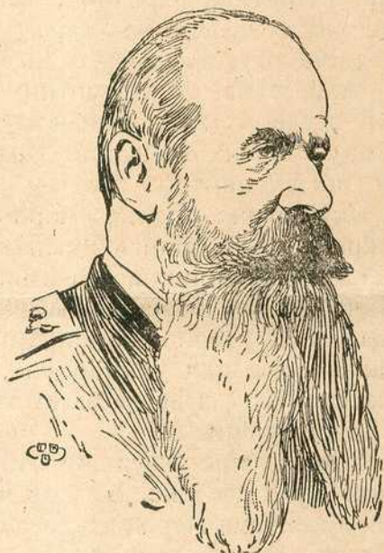
† Степан Осиповић Макаров рођен 1848, погинуо 31. марта (13. апр.) 1904.

Руску морнарицу код Порт-Артура задесио је у среду тежак удар. Јапанска флота приближила се из јутра Порт-Артуру, на који је већ толико пута ударала. Кад су се јапанске лађе