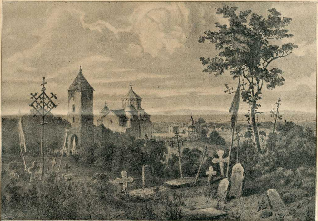
Манастир Жича у Србији.

и Немци, у Бачкој Немци и Мађари. Заузели су силне просторе од нас, много и много места изгубисмо, само српска имена тих места и потеса сведоче о некадашњем њихову српском обележју. Сада газе те земље само ноге Срба, слугу немачких господара . У Бачкој узмичемо све више према југу. Па и у Срему стојимо врло рђаво. У источним, а у неку руку и у јужним крајевима потиснути смо силно. Ако, не дај Боже, овако дуже потраје, зло ће од нас бити, пропашћемо у тим крајевима. У неким чисто српским опћинама пре 40 година не можемо