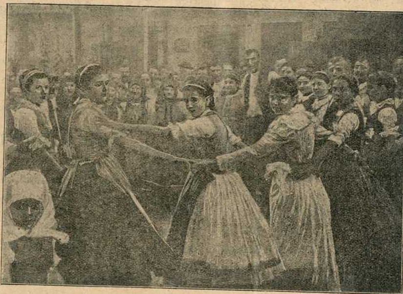
Збежанке и Калашкиње (Српкиње крај Пеште) играју коло.