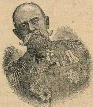
Генерал Љињевић, врховни заповједник руске манџурске војске.

својој молби каже Куропаткин, да ће му поћи за руком повратити свој глас као војсковође, ако га цар именује за заповедника прве војске. Стари „папаша“ Љињевић, како га војници зову, помогао је молбу Куропаткинову код цара. Кад је војска чула, да Куропаткин остаје она је била јако весела, јер Куропаткина војници воле и поштују, ма да није био срећан доселе у рату с Ојамом. Сва руска штампа хвали у звезде овај корак Куропаткина, који је показао како воли свој народ и своју отаџбину.