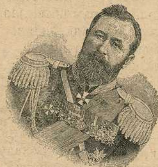
Генерал Куропаткин бивши врховни заповједник, а сада заповједник прве војске.

пукао данашњи рат, заповедао је Љињевић трупама у Владивостоку, а затим је постао заповедником I. војске код Куропаткина. Стари папаша омиљен је код све војске, а особито код сибирских регимената, и на гласу је као енергичан војник јаке воље.