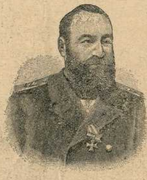
Адмирал Алексејев бивши царски намјесник у Азији.