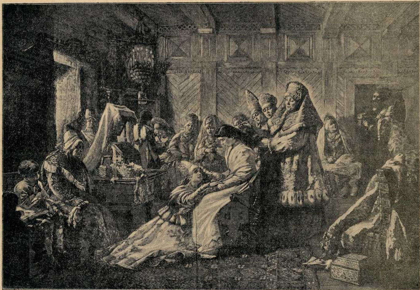
Из Русије: Кићење невесте пред венчањем.

Цео свет с великом пажњом очекује поморску битку, која је на догледу, а која ће се крваво одиграти између руске и јапанске флоте.