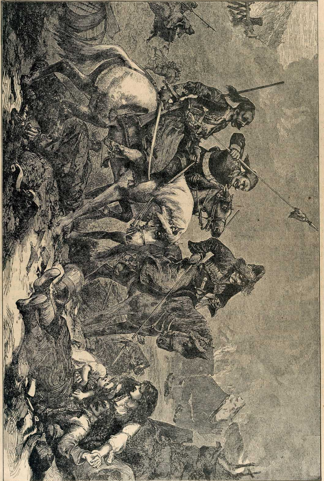
Зулуми османлијских низама у Македонији.