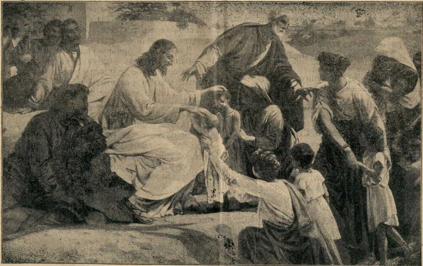
„Пустите децу к мени, јер је њихово царство небеско“ (са иконе Уроша Предића).

ресеји, учени дакле људи, јер је мрсио њихове рачуне, гонио га је и мрзио и остали свет, јер га није разумевао, у последњем су га се часу одрицали и ученици његови, разбежали су се, а Петар га се три пут одрекао, па ипак је Господ, на крсту умирући, гласно рекао за мучиоце