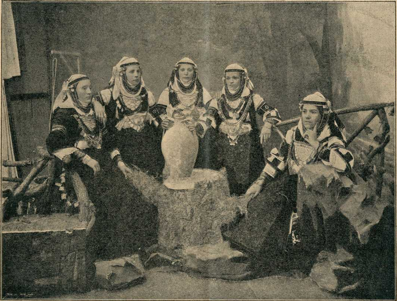
Српкиње из солунског вилајета.

одлуке комасацијоног повјеренства, којом допушта и одређује извођење комасације, док у другом случају б) могу противници комасације ставити за 14 дана уток кр. земаљском комасацијоном повјеренству.