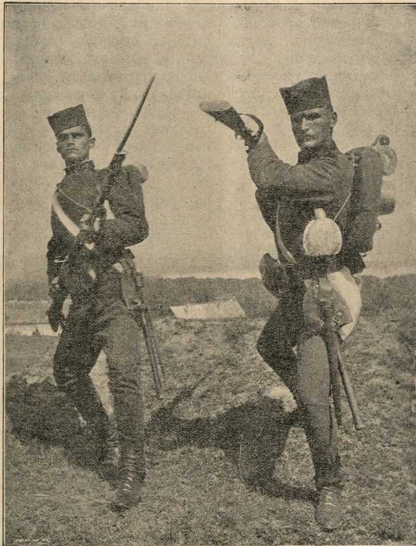
Српски пешак у одбрани.

Нова државина, коју добије комасацијом поједини учесник, треба да је по могућности једнаког положаја, површине и каквоће са старим