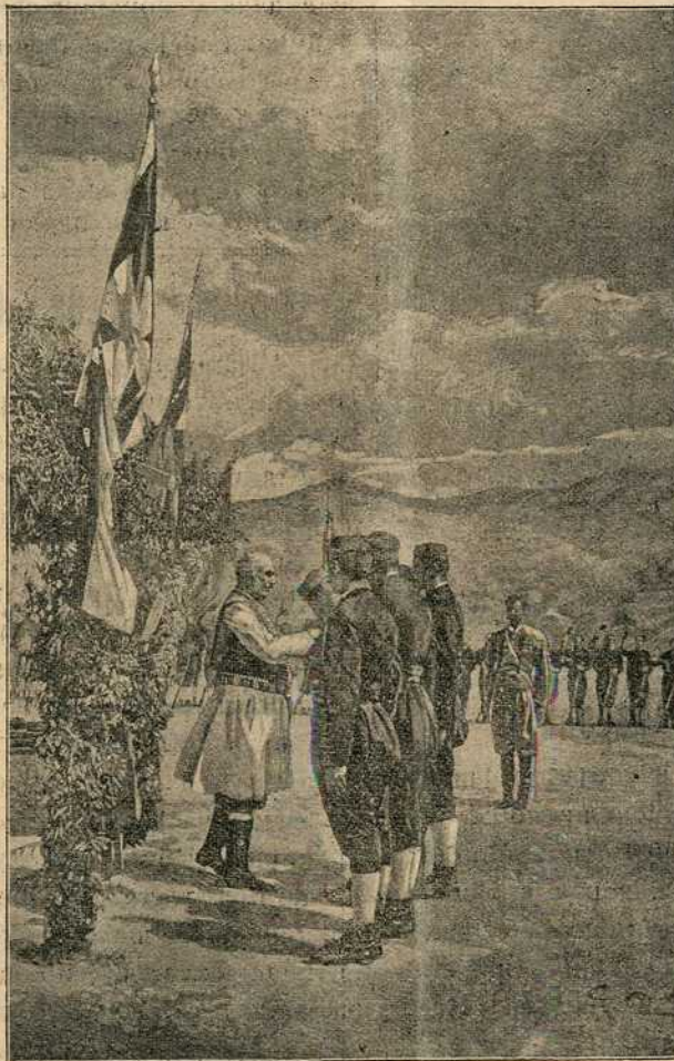
Кнез Никола дели војсци руске пушке.

Сабор је угарски одгођен до 15. септембра. Државни су послови стали, пореза се не плаћа, не може да се дође до рекрута, жупаније отказују послушност незаконитој влади, трећегодишњаци ће служити и преко своје службе, а хоће ли влада бити кадра позвати ерзацрезервисте у службу, то се још не зна. Осим тога стоје сви важнији други државни послови. Води се очајна борба између Беча и Пеште. Беч поручује преко Фејерварија, да ће дати Маџарима, што год хоће, нека раде у држави с народностима: Румунима, Немцима, Словацима, Србима и Хрватима, само нека не траже војске. Допустио би Беч, да раде