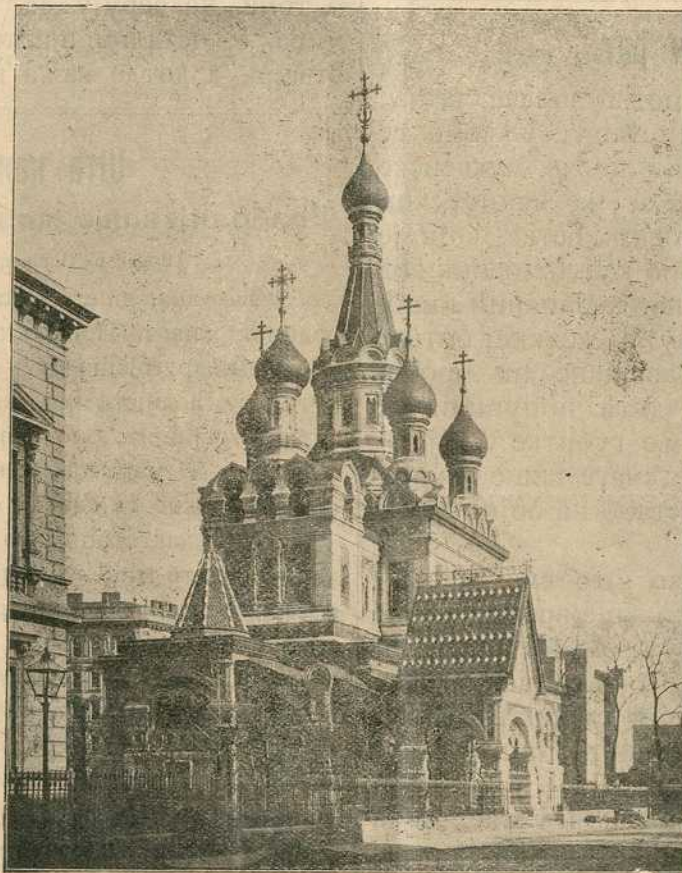
Православна руска црква у Бечу.

Срби се силно прориједише у тим непрестаним бојевима и раштркаше се по свој Угарској. Текар великом ссобом Срба у Угарску, под на-