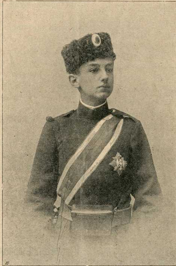
Наследник пријестола Ђорђе као српски војник.

Крај тога, сине, срце твоје мора бити испуњено само љубављу према сваком грађанину српском. Никада ни једног тренутка, не сме владалац осетити мржњу ни према коме поданику своје. Ма како био уман и спреман владар не може да врши све државне послове сам. Зато је потребно много људи и најтежи је задатак владаочев да их пронађе. У томе тешком послу за владара ће бити велика олакшица, ако никога не буде мрзео, ако свакога буде подједнаком љубављу примао и са њим се саветовао.