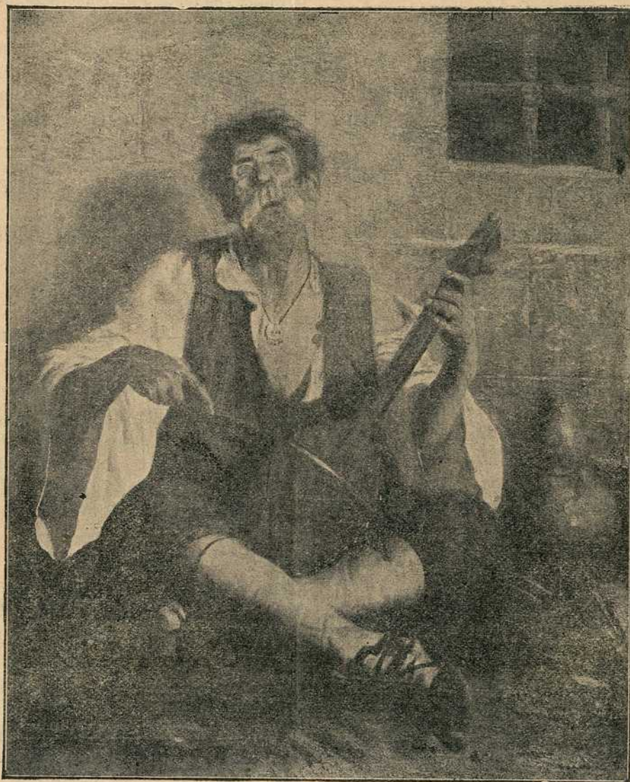
Гуслар, слика Р. Вукановића.

Најприје плануше јаничарске куће у селу Сибници. Чим се то рашчу, плану устанак као сух барут на све стране.