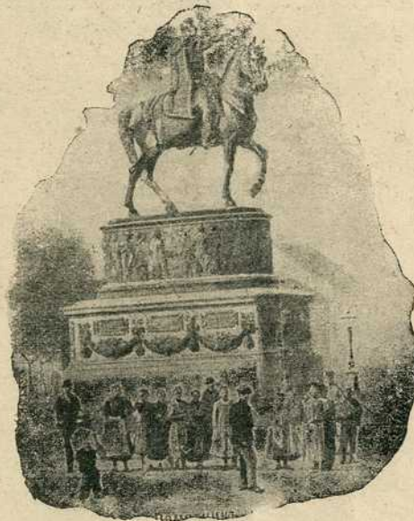
Споменик кнеза Михајла у Београду.

Позив резервиста на војничку службу. О позивању резервиста на војничке вјежбе изишла је ова краљева заповијест: „Заповиједам, да се у колико је потребно, за попунидбу мировног стаљиша чета, области и завода, што но се имаду попунити из земаља круне угар-