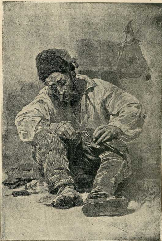
Козак на невољи.

У Русији се народ свуда умирује. Цар је учинио народу велики поклон. Познато је да су руски ратари до 1863. године били кметови. Онда су текар добили земљу, али су је морали отплатити помало у много година пређашњим власницима, племићима, управо држави, јер је држава исплатила племиће у име ра-