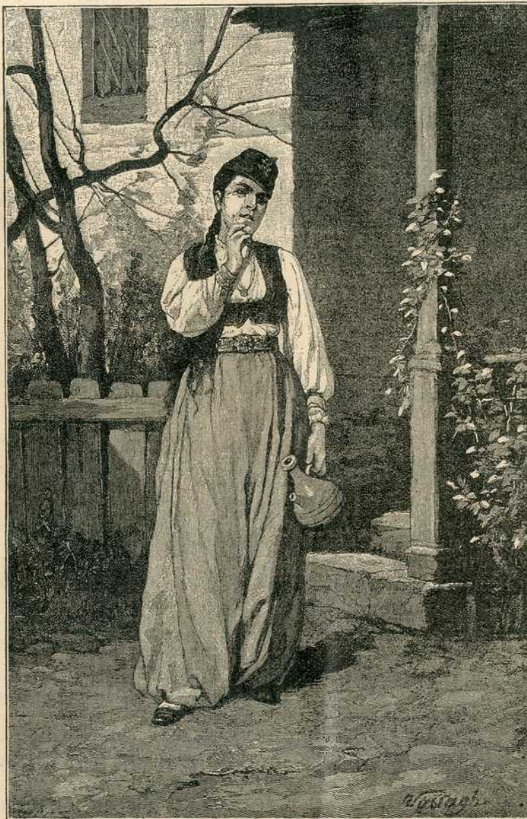
Босанка. Сликао Ђорђе Ваштаг.

Све се на расправи обавља усмено, расправа је јавна, то јест, могу јој присуствовати, бити на њој, и други људи, којих се ништа не тиче читава ствар. Пред мјесним судом се не смију људи записизати.