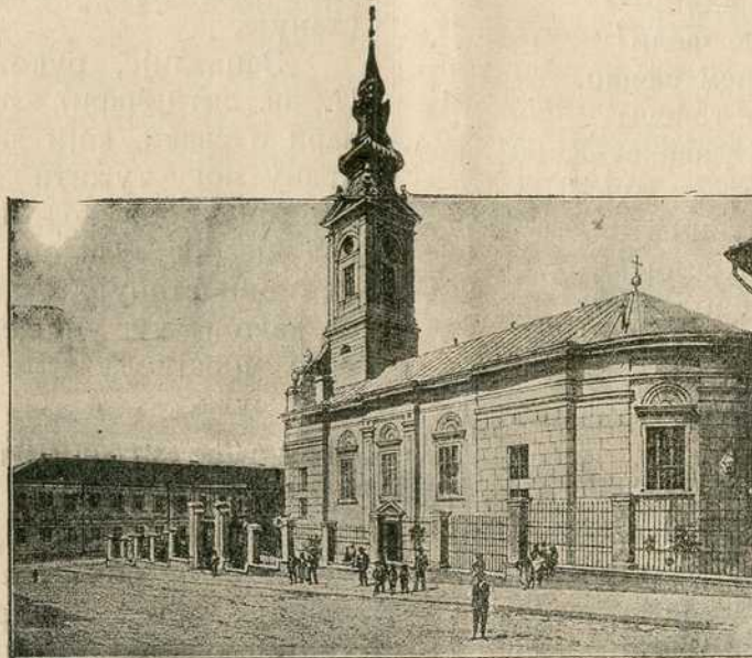
Србија: Саборна црква у Београду.

Срби сви и свуда, помислите на ово што сад рекосмо, држећи се оне свете српске ријечи: Само слога Србина спасава. А.