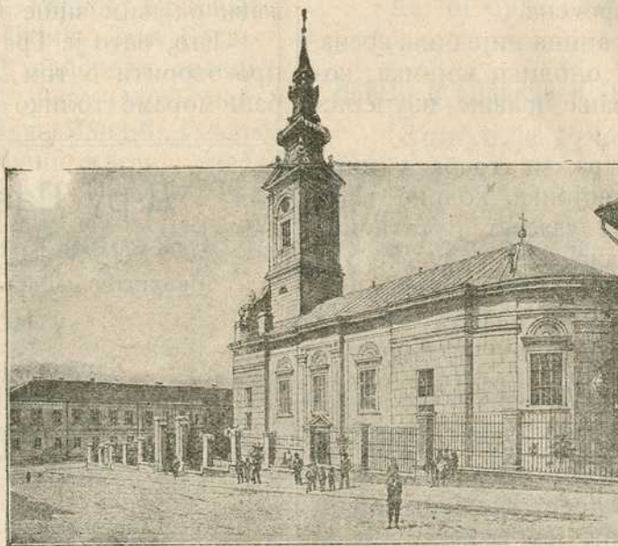
Србија: Саборна црква у Београду.

А да у „црном испод ноката“ доиста може бити кужних клица, доказано је и искуством и науком. Познато је н. пр. да се по гдекада и најмања повреда, и најситнија чибуљица „на зло да“, ако је „поганим ноктима рашчешемо“; да се од чешања и драпања (ноктима) сва кожа узбуди и запали, па често и суседне жлезде натекну; да се мале крастице и пљускавице ноктима по целом лицу разнесу и т. д. Опитом је доказано, да у „пр-