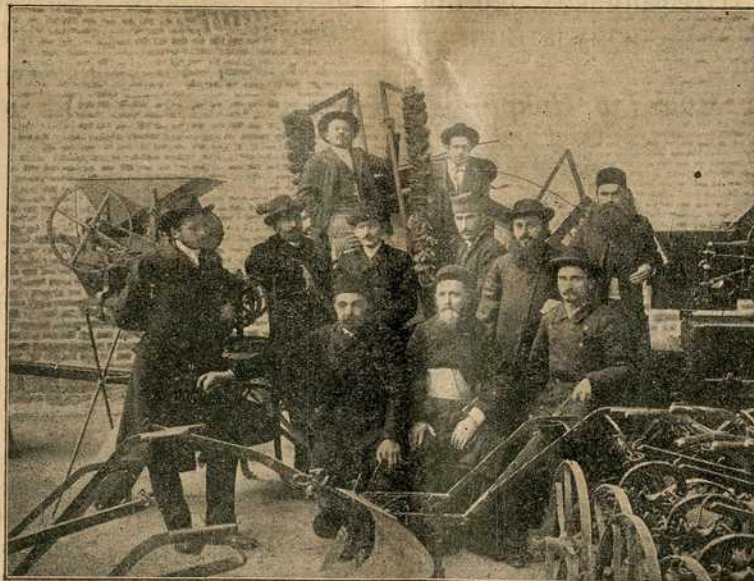
Надзорни одбор главног Савеза земљ. задруга.

Желимо браћи задругарима у Србији највеће успехе.