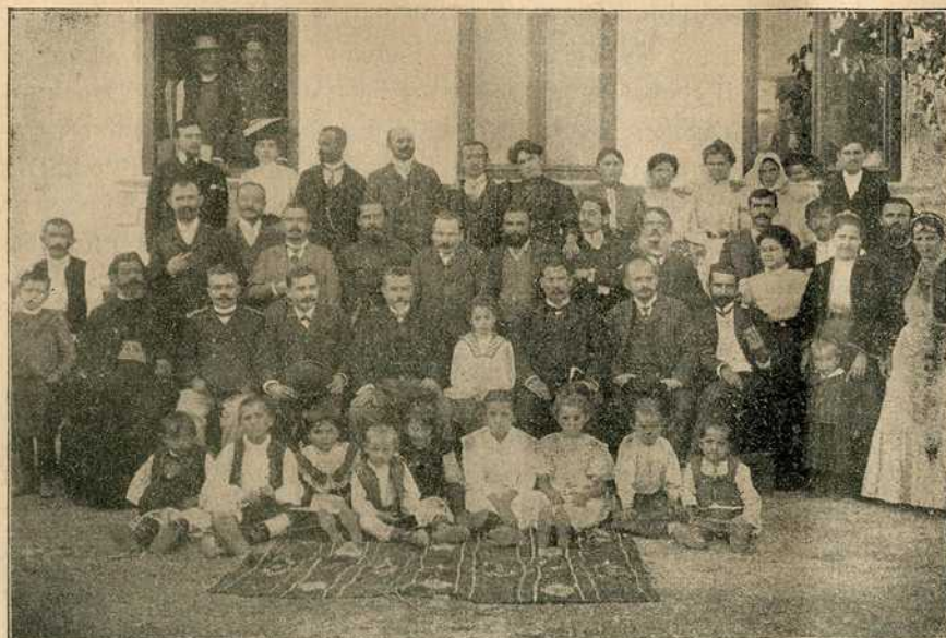
Гости при отварању школе у Пиносави.