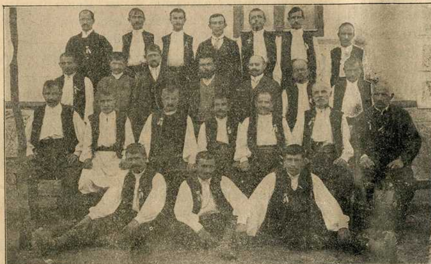
Опћ. и школски одбор у Пиносави.