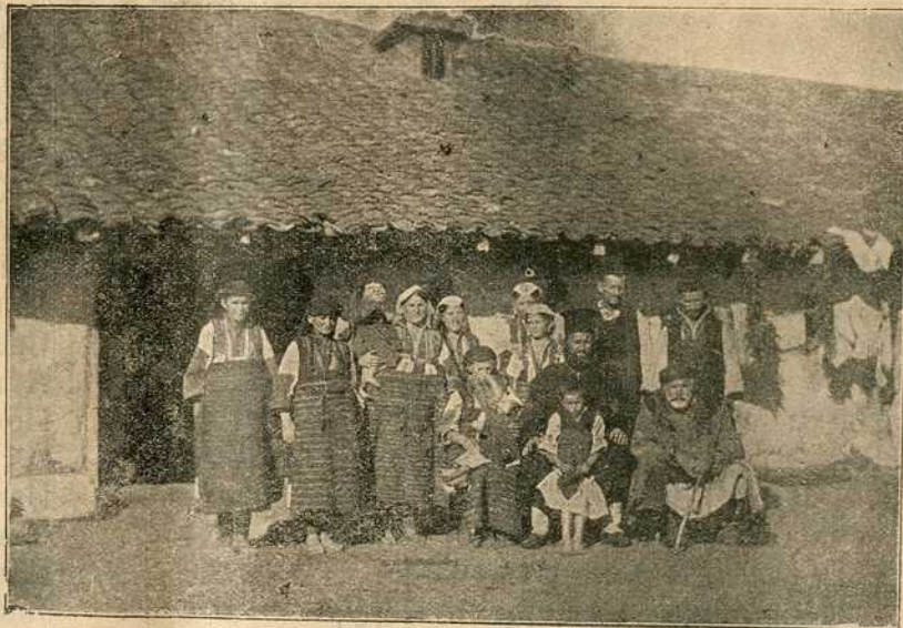
Срби сељаци са Косова.

војник пострада. Код града Полтаве потуче га 27. јунија 1709. г. цар Петар управо страшно. Сва шведска војска или изгибе или би заробљена. Карло побјеже у Турску са шаком људи.