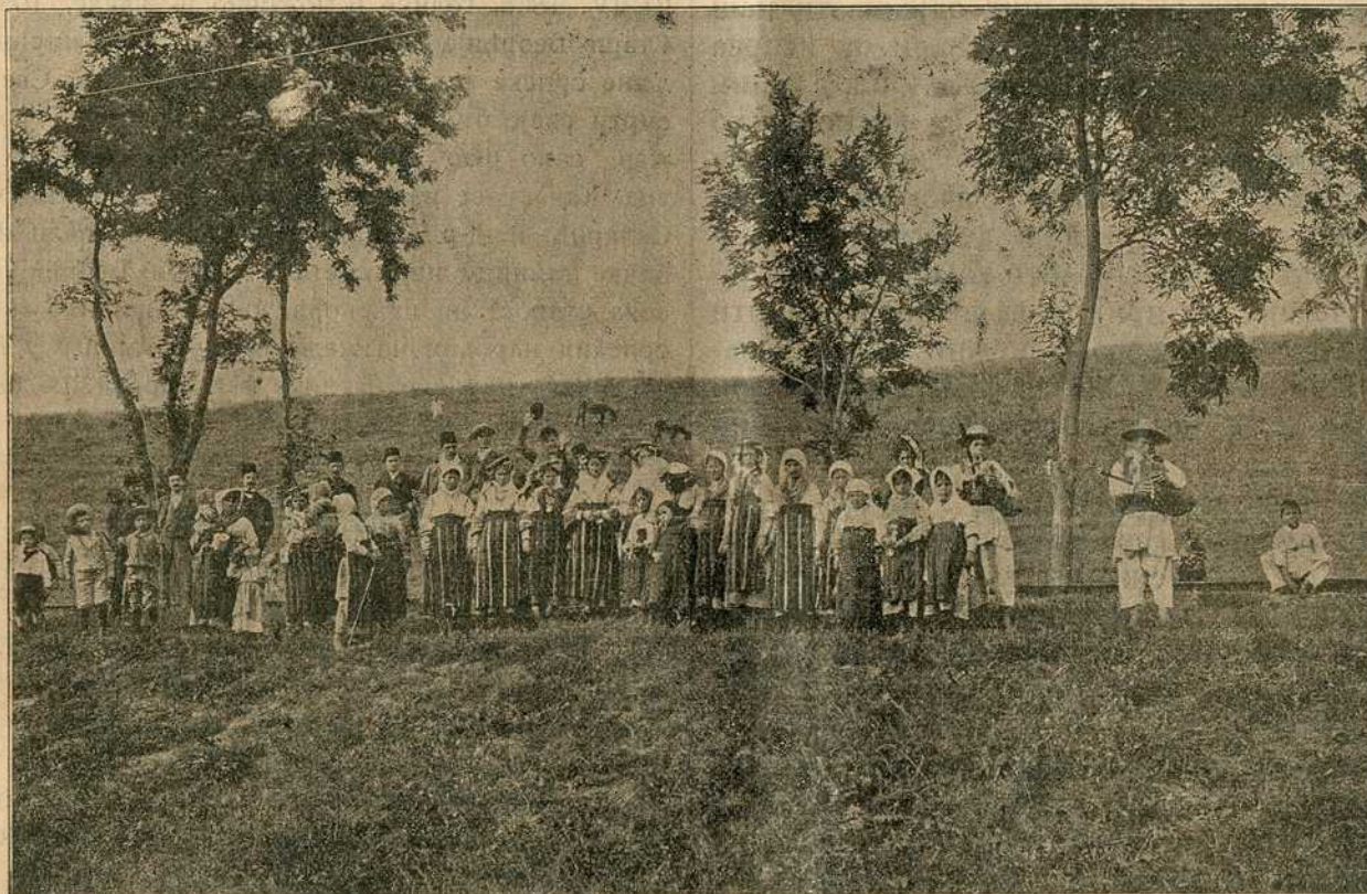
Срби у Старој Србији окупљени у пољу о празнику.

рал копнене војске Румјанцев освоји Влашку, смрви у неколико бојева турску војску и пријеђе Дунав с руском војском. Послије 900 го-сад је први пут руска војска прешла Дунав. На ријечи Кагугу потукао је он са пуких 17.000 Руса турску војску у којој је било 150.000 Турака и 80.000 Татара. Турака и Татара пало је мртвих и тешко рањених 20.000, више за 3.000 него што је било свега Руса. А Руса пало је само 900. 1774. године замоле Турци мир. Русија добије простране земље и друге погодности.