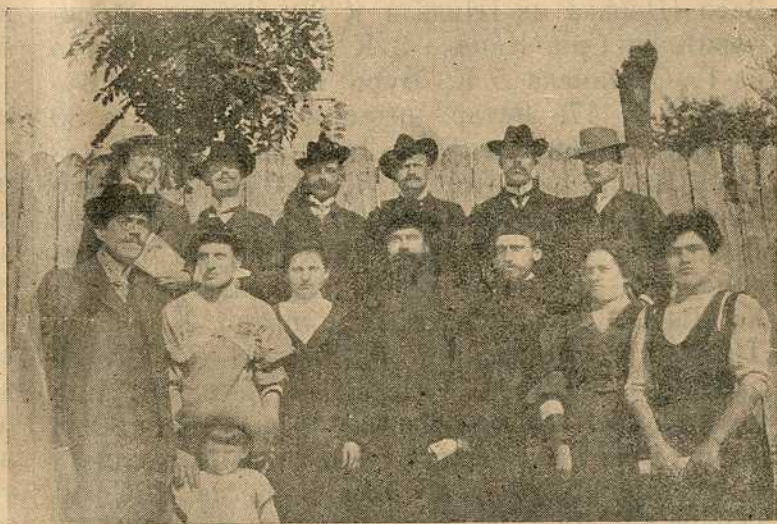
Свештеници и учитељи у срезу Млавском (у Србији) после једног предавања за народ

Зато он 1790 године напише књигу у којој изнесе све то, све народне патње и лопов-