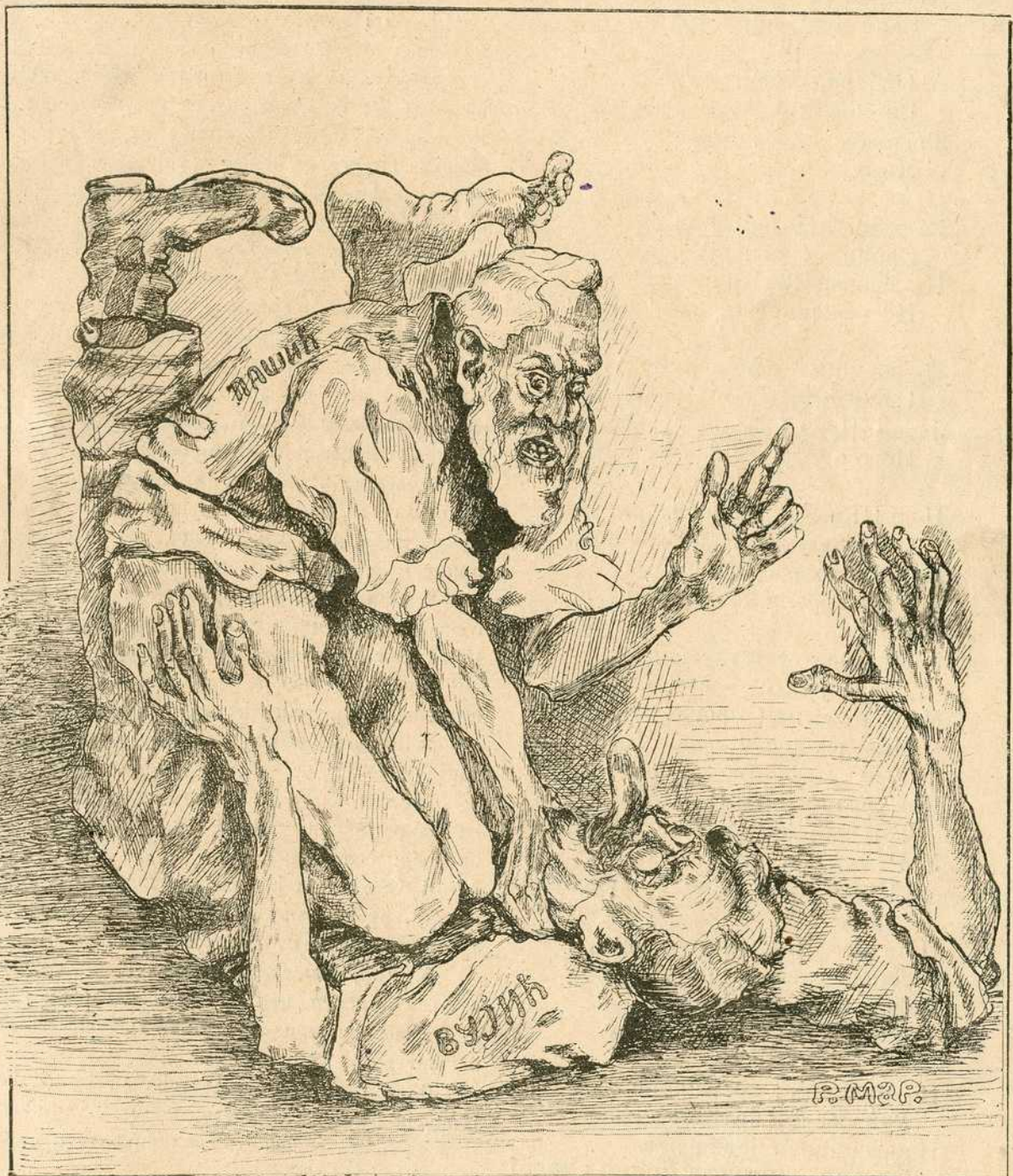
П—ћ: Да гу видим бре, тај твој дугачки језик! Видиш бре, што ти је се фаћа, кад се противу више власти жалиш!?