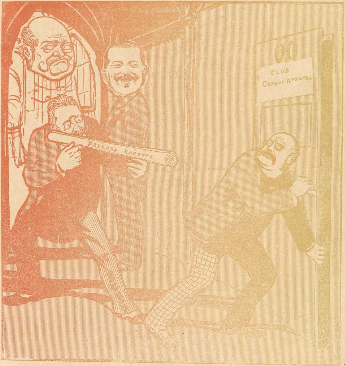
Барон Раух: Чудна пушка!?