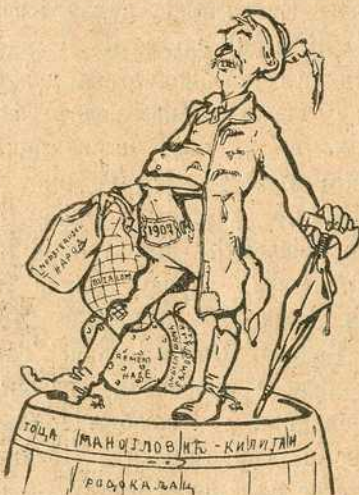
(раодонајсног пропалог кандидата за црвени Сабор).

Браћо моја! Ако сам пропао, пропао. Теш ми то да је и у Срему пропало наших 18 кандидата, којих смо били Рауху обећали. Али види се да народна пословица има право кад вели: Обећање лудом радовање!