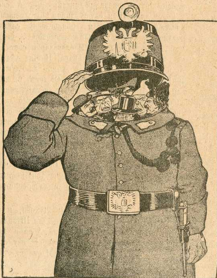
(По једној неостварљивој идеји Фрање Кошута).