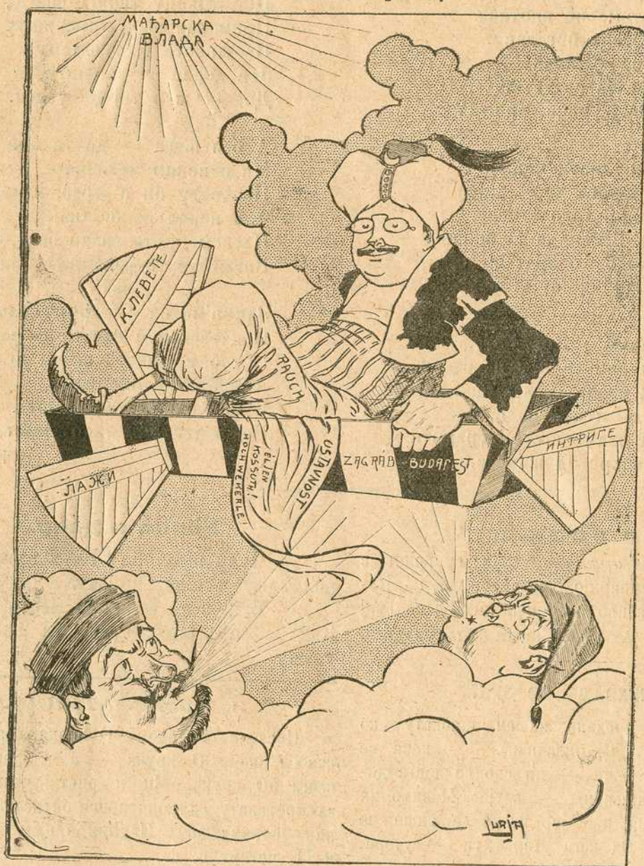
(20 недеља тумарања по ваздуху — у мртвачком сандуку — чувеног политичког мртваца, потурице Рауха).