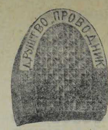
ПОТПЕТИЦЕ ОД ГУМЕ