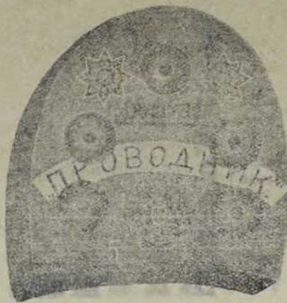
ПОТПЕТИЦЕ ОД ГУМЕ