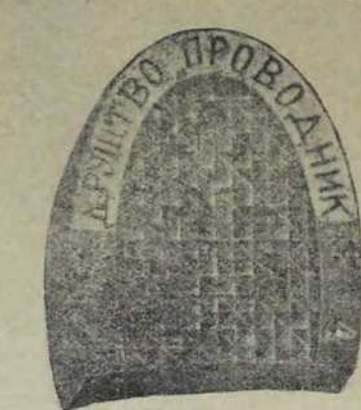
ПОТПЕТИЦЕ ОД ГУМЕ