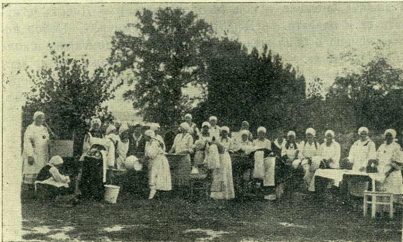
Ученице домаћичке школе перу рубље.