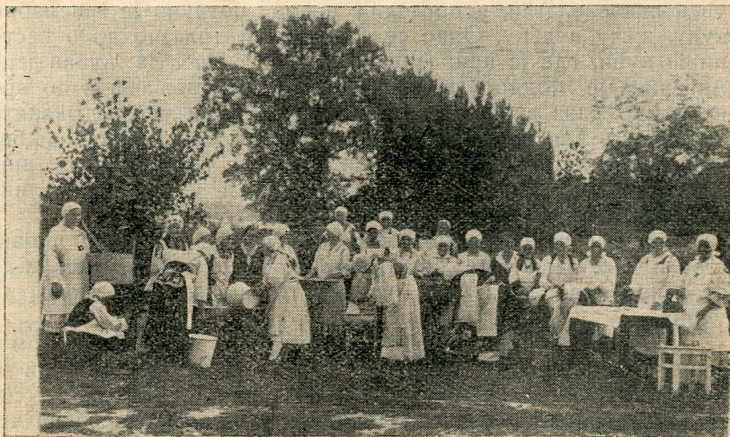
Ученице домаћичке школе перу рубље.

Настали су топли дани, човек се лети више зноји, које од врућине које од рада. Кад се често купаш и переш а после купања кад пресвучеш рубље, осећаш се препорођен.